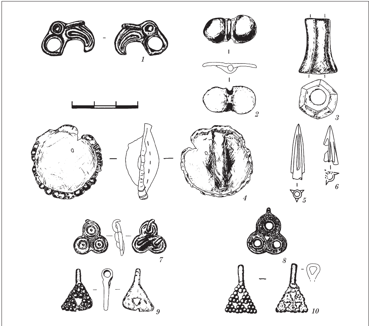
Рис. 3. Детали сбруи коня, украшения и наконечники стрел

Привеска может быть датирована V в. до н. э. [Петренко, 1967, с. 93; Ковпаненко, Бессонова, Скорый, 1989, с. 163, рис. 29, 10] или в более узких пределах — середина — вторая половина V в. до н. э. [Могилов, 2008, с. 83, рис. 152, 20].