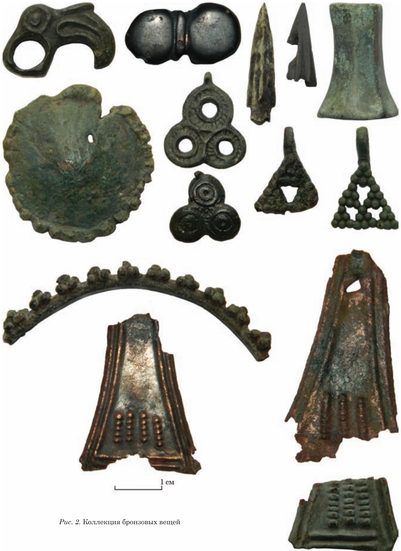
Рис. 2. Коллекция бронзовых вещей