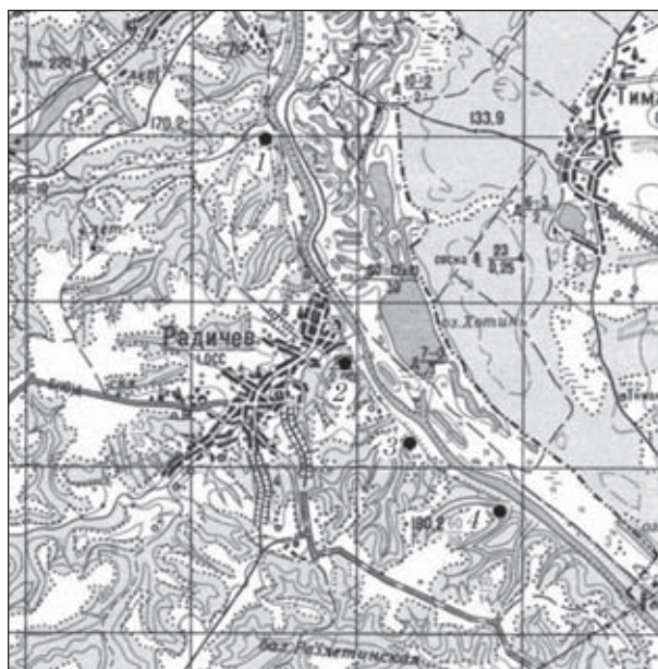
Рис. 1. Карта городищ у с. Радичев Черниговской области: 1 — Пузырь Хутор; 2 — Мещанское; 3 — Хотинское; 4 — Московское

1. Подвеска в виде головы хищной птицы (рис. 3, 1). Размеры — 2,4 × 1,6 см. На двухсторонней подвеске концентрическими окружностями передан глаз. На клюве рельефно изображено ротовое отверстие и надклювье. В нижней части изделия располагается округлое отверстие для крепления диаметром 0,6—0,7 см. На нем видны следы потертости от ремня. Аналогии таким вещам известны на лесостепных памятниках скифского времени, в частности в кургане 412 у с. Журовка, и в Крыму [Скорый, Зимовец, 2014, с. 73].