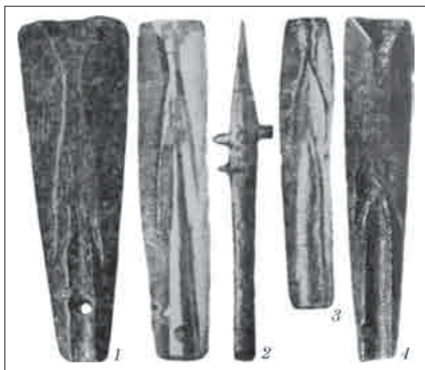
Рис. 5. Випадкові знахідки ливарних форм з України: 1 — Більське городище; 2 — с. Букрин Київська обл.; 3 — колекція О.О. Бобринського; 4 — Ольвія

нечники, тому форма мала ще конструктивні бокові стулки.