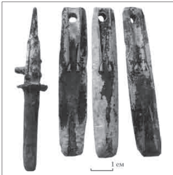
Рис. 4. Форма 2 із скарбу з Тернопільської обл.