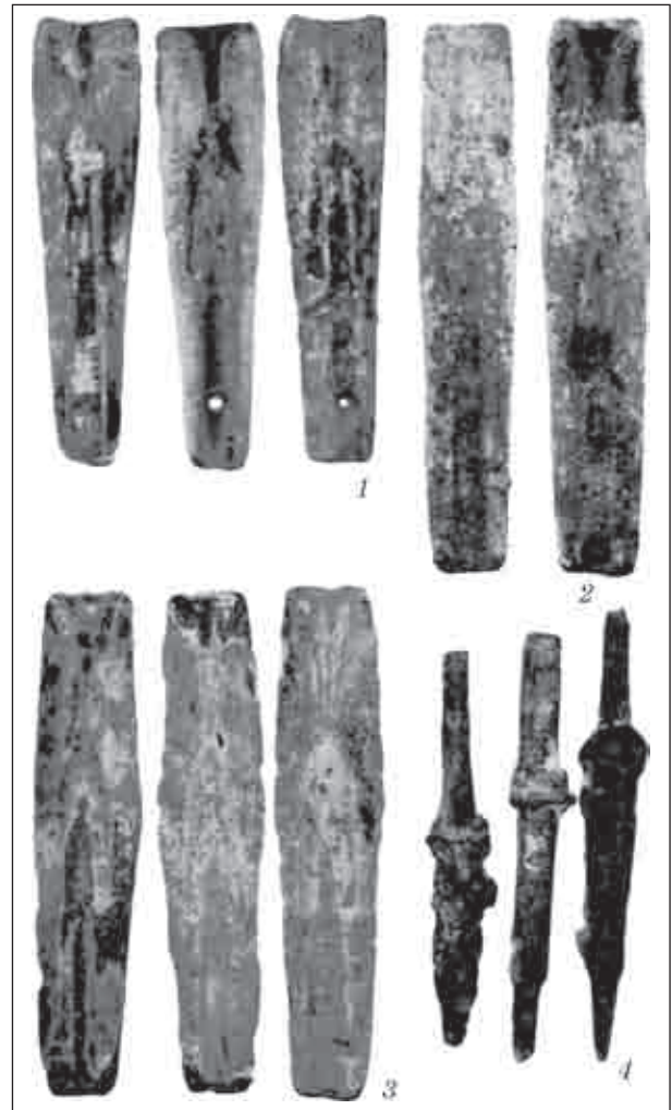
Рис. 2. Трьохстулкові форми із скарбу з Полтавської обл. (1—3); фіксатори від ливарних форм (4)

В цілому всі описані форми аналогічні тим, що відомі на скіфських пам'ятках на території України і за її межами. Деякі відмінності у зовнішній формі не мають суттєвого характеру. Принцип їх використання однаковий. Наприклад форму із першого скарбу, в якій відливалися два наконечника, автор першої публікації цілком правомірно порівнює із відомою формою із Мосула (Ірак) [Зеленин, 2013, с. 242]. Відмінність полягає в тому, що в останній відливалися три трьохлопатеві нако-