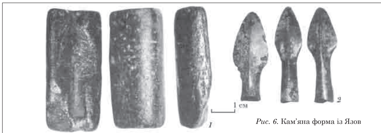
Рис. 6. Кам'яна форма із Язів

акінаки з метеликоподібними перехрестями із Зуївського і Луговського могильників; скіфське дзеркало «сибірського» типу з центральною ручкою у вигляді двох стовпчиків, які підпирали бляшку із зображенням тварини, із Маклашівського могильника; ажурна бляха у вигляді хижака, що згорнувся у кільце, яка походить з Анан'їнського могильника [Збруева, 1952, с. 30, 35, 37, 100].