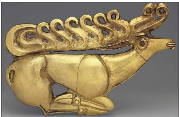
Рис. 2. «Костромський олень», золота пластинка горита, кінець VII ст. до н. е., Ермітаж, інв. № 2498/1, за (Алексеев 2012, с. 64)

ав. varāza -. Цей факт вказує, що другу частину назв оленя та вепра слід виводити не від основи * aža - «коза, козел», а від дієслівного кореня * 1až - «гнати, поганяти» 1 .