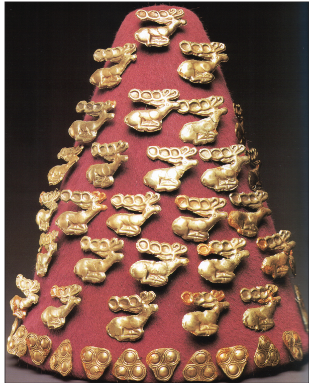
Рис. 4. Реконструкція головного вбрання, прикрашеного золотими бляшками у формі оленів з кургану 100 біля с. Синявка, кінець VII — початок VI ст. до н. е., МКУ, інв. № 238—239, за (Reeder 2001, p. 150 (43))