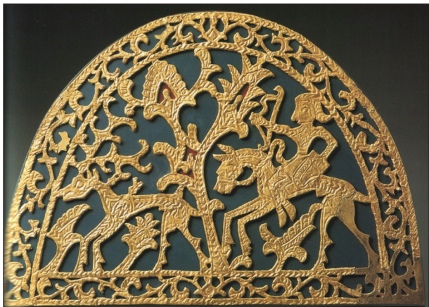
Рис. 1. Сцена полювання на золотій гюнівській пластині, IV ст. до н. е., МКУ, інв. № АЗС-2926, за (Reeder 2001, p. 255 (123))