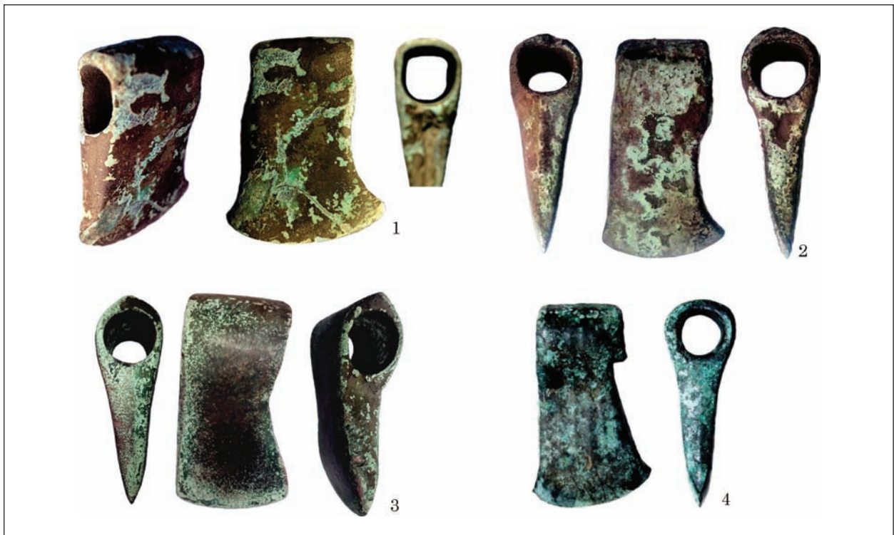
Рис. 7. Варіант «сокири лісорубів»: 1 — Чернігівщина; 2, 3 — Харківська обл.; 4 — Станятин, повіт Томашів Любелський, Польща

2), у Тернопільській обл. (Віоліті, 16.09.2016), м. Київ (Віоліті, 27.11.2016), Черкаській обл. (Віоліті, 27.08.2018) (рис. 4: 1—10). Сокири, знайдені біля с. Ксаверово Городищенського р-ну Черкаської обл. (Колекція А. В. Козименка, надходження 2018 р., аналіз 1783) (рис. 3: 11) та з селища Дібровка Золотоношського р-ну Черкаської обл. (Колекція А. В. Козименка, надходження 2018 р., аналіз 1782) (рис. 4: 12) виготовлені з миш'якової бронзи (рис. 9).