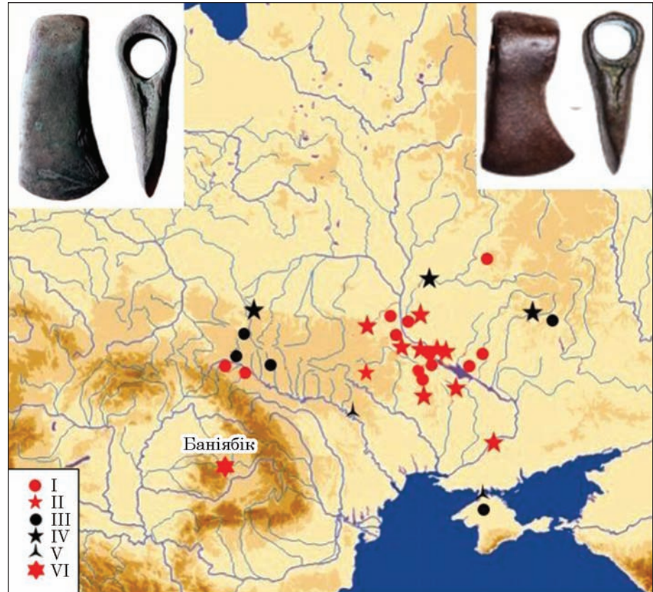
Рис. 9. Мапа сокир типу Баніябик: I — варіант Гречаники; II — варіант Підлісся; III — варіант Рудня Мала—Маліївці; IV — варіант «сокири лісорубів»; V — варіант «сокири теслярів»; VI — скарб Баніябик

с. Рудня Мала Жешовського воєводства Польщі (Клочко 2006, рис. 50: 1), с. Маліївці Дунаєвського р-ну Хмельницької обл. (Клочко, Ко-