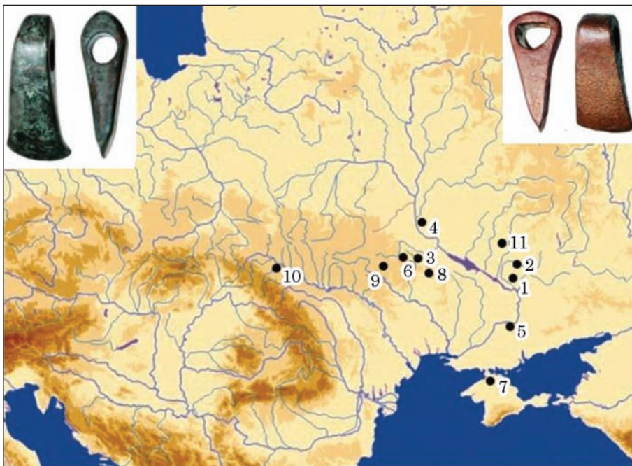
Рис. 2. Мапа сокир самарського типу

матриці, розташовану з «внутрішнього» боку сокири — техніка лиття у відкрите «черевце» (рис. 1: 1, 2).