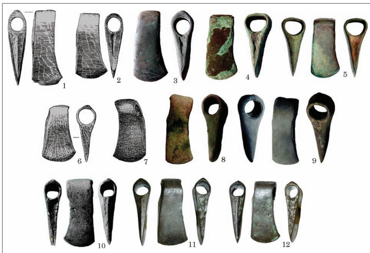
Рис. 4. Варіант Гречаники: 1 — Гречаники; 2 — Гнідин; 3 — Полтавська обл.; 4 — Сумська обл.; 5 — Черкаси; 6 — Стайки; 7 — Пістинь; 8 — Тернопільська обл.; 9 — Київ; 10 — Черкаська обл.