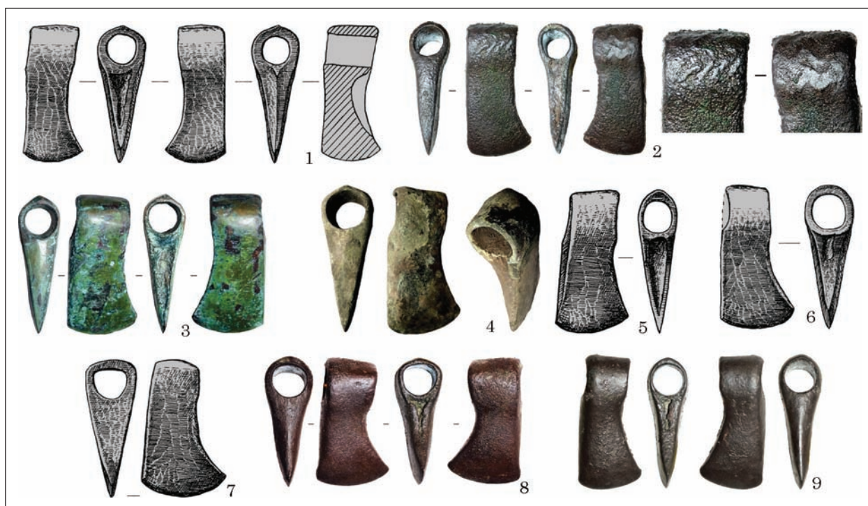
Рис. 5. Варіант Підлісся: 1 — Підлісся; 2 — Світловодськ; 3 — Кедина Гора; 4 — Макарів; 5 — Чапаївка; 6 — «Київщина»; 7 — Грищинці; 8 — Смільчинці; 9 — Вишківці

Полтавській обл. (Віоліті, 24.06.2016), у Сумській обл. (Віоліті, 09.04.2017), біля м. Черкаси (Віоліті, 21.04.2017), біля с. Стайки Кагар-