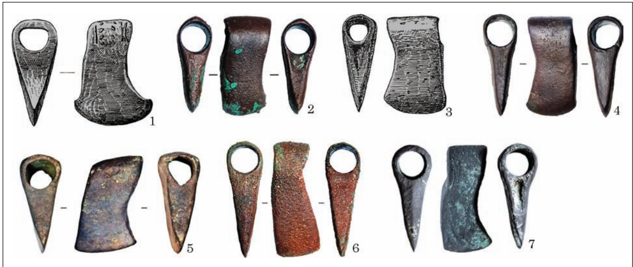
Рис. 6. Варіант Рудня Мала — Маліївці: 1 — НМІУ; 2 — Тербовлянський р-н; 3 — Рудня Мала; 4 — Маліївці; 5 — Степовий Крим; 6 — Вороновиця; 7 — Харків