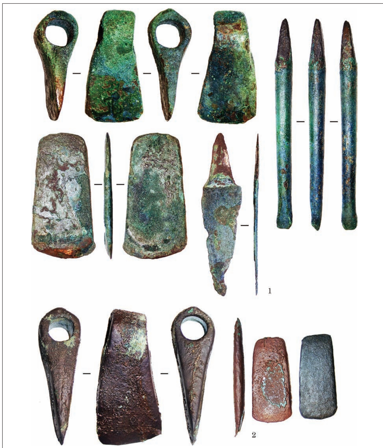
Рис. 8. Варіант «сокири теслярів»: 1 — Красноперекопськ; 2 — Івонівський скарб

2017, 2.1.1, аналіз 1826) (рис. 6: 3), біля смт Макарів Київської обл. (Віоліті, 26.12.2016), села Чапаївка Золотоніського р-ну Черкаської обл. (Клочко 2006, рис. 25: 3), на «Київщині» (Клочко 2006, рис. 25: 1), біля с. Гришинці Канівського р-ну Черкаської обл. (Клочко 2006, рис. 25: 4) (рис. 5: 4—7), біля с. Смільчинці Лисянського р-ну Черкаської обл. (Клочко, Козыменко 2017, 1.3.3, аналіз 1695) (рис. 5: 8), біля с. Вишківці, Немирівського р-ну Вінницької обл. (колекція А. В. Козименка, надходження 2018 р., виго-