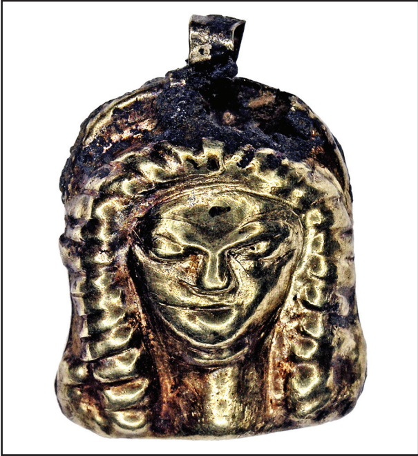
Рис. 2. Зображення жіночої голівки в стефані (курган 34 поблизу с. Софіївка)