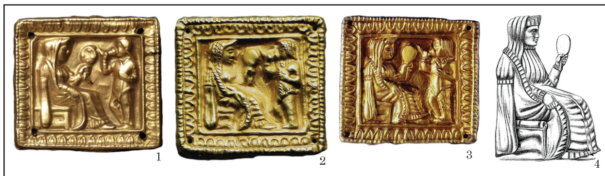
Рис. 8. Золоті пластинки із зображеннями «сцени адорації»: 1 — мініатюра з кургану Чортомлик; 2 — аплікація з Мелітопольського кургану; 3—4 — пластинка з кургану 4 поблизу с. Носаки

(одне з умовних означень сюжету) на золотих пластинках: в рамці з овів вміщено зображення жінки в опатному вбранні, яка сидить на троні, та юнака, що стоїть перед нею, тримаючи ритон (рис. 8). У руці жінки дзеркало — атрибут богині Аргімпаси. Обоих учасників дійства показано у профільному ракурсі, але давній художник зумів передати особливості форм головного убору, плечового та поясного одягу. Почнемо з голови: над чолом скіф'янки — невисока циліндрична шапочка з дугоподібним вигином спереду нагадує стефану. Археологічні знахідки — декоративні засоби для оформлення фронтальної частини полоса є джерелом для реконструкції головних уборів у вбранні представниць скіфської еліти. Найпишніший декор вирізняв полоси, відтворені за матеріалами з курганів Товста Могила поблизу м. Покров, Чортомлик (Дніпропетровська обл.), № 22 (п. 2) поблизу Вільна Україна, № 9 поблизу с. Мала Лепетиха (Херсонська обл.), Великий Рижанівський (Черкаська обл.) тощо. Ці циліндричні убори мають ознаки полосів , а їх варіативні особливості варто зафіксувати за «іменем» кургану.