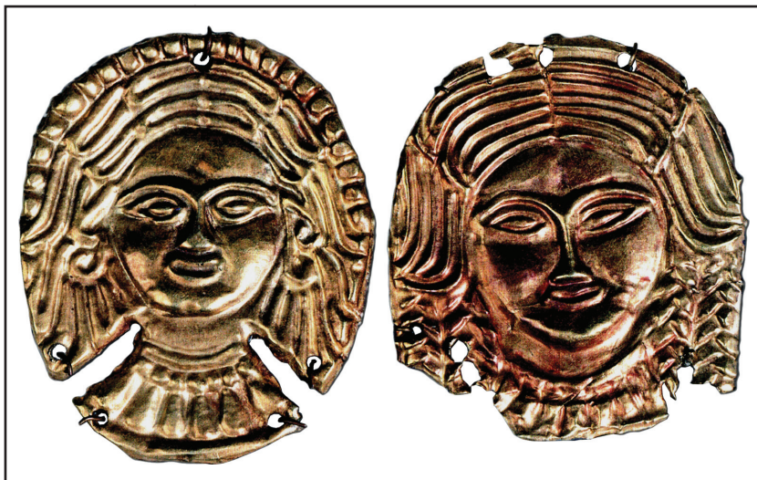
Рис. 4. Жіночі образи на пластинках з кургану 1 (1897 р.) поблизу с. Вовківці

Волосся трактовано рельєфними лініями у вигляді тугих пасом, з-під яких вибиваються ніжні кучерики, а на двох пластинках показано коси. Але відмітимо, що грецькі жінки не заплітали волосся в коси — на всіх пам'ятках образотворчого мистецтва показано локони. Мабуть, давній художник відтворив зачіску, характерну для жінок цього регіону. Відомо, яким символічним змістом сповнене жіноче волосся у всіх індоєвропейських народів. Йому приділяли велику увагу, вважаючи зосередженням «жіночої сили». Спостереження етнографів свідчать, що заплітання та прикрашання кіс, було звичним у багатьох народів. Повернемося до зображень на «Вовківецьких» пластинках. На шії жінки — разок з намистин і підвісок. Крім того, аналіз деяких портретів (жінка з кучерями) дозволяє припустити, що серед пасом волосся зображено кільцеподібні сережки (рис. 4). В. Іллінська припускала, що для створення цих жіночих образів, давній майстер мав взірць: «...пластинки та медальйони із зображенням богині Деметри з пишною зачіскою та намистом, або, можливо, голови Афіни у крилатому шоломі з локонами, що спускаються з-під нього» (Ільинская 1968, с. 143).