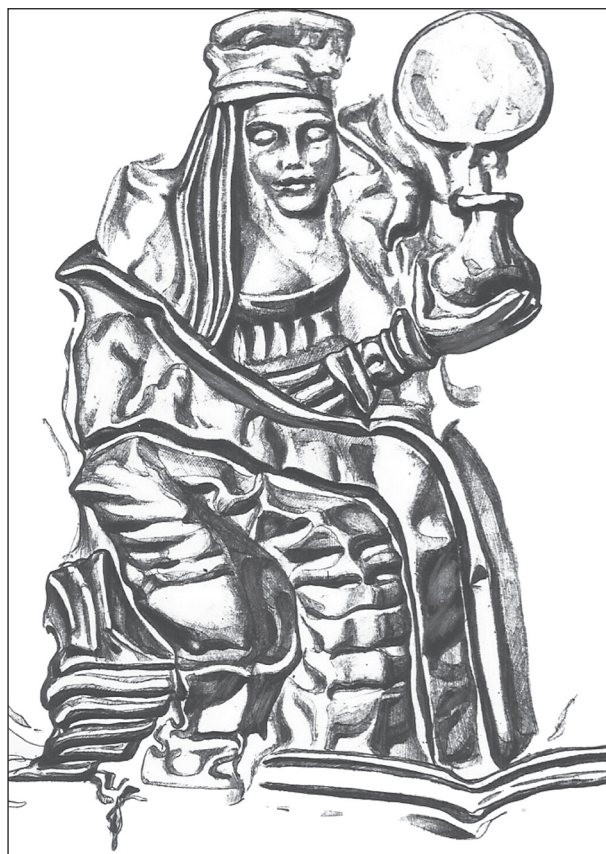
Рис. 6. Зображення жінки у парадному костюмі — центральний персонаж в композиції на золотій пластині з кургану 4 поблизу с. Сахнівка

З циліндричними уборами пов'язані декоративні елементи, які відбивають особливості форми: здебільшого прямокутні пластинки, смужки, стрічки, обідки з підвісками тощо. Зазначені декоративні деталі є «формотворчими», тому що чітко відбивають особливості поверхні, на якій їх прикріпляли. Аналіз оздоб дозволяє визначити певні пунктирні лінії, за якими можна відтворити головний убір. «Формотворчі» прикраси використовували для різ-