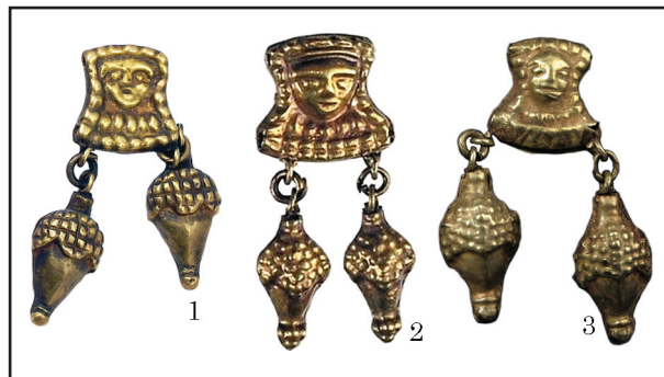
Рис. 1. Мініатюрні «портрети» на ланках золотих ланцюжків: 1 — курган поблизу с. Лазурці; 2 — курган поблизу с. Софіївка; 3 — курган 2 (пох. 2) поблизу с. Чкалове

Схожі коробчасті ланки нашийної прикраси знайдено в кургані 2 (пох. 2) поблизу с. Чкалове (Дніпропетровська обл.). Контури пластинки з трьох сторін підкреслені опуклими квадратами, а нижня основа виділена ширшим рельєфним візерунком у вигляді зигзага, прокресленого тоненькою неглибокою лінією. Вище — разок намиста на шиї персонажа. У центрі мініатюри вміщено зображення злегка витягнутого обличчя з мигдалеподібними очима і великим ротом. Над чолом опуклими квадратами намічено убір, силует якого нагадує трапецію, обернену основою догори, а з двох боків меншими опуклинами позначено покривало (рис. 1: 3). Портрети на всіх пластинках