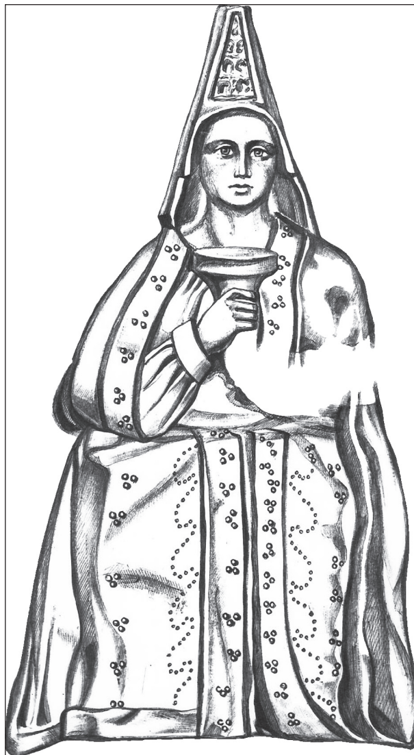
Рис. 11. Зображення жінки в опатному костюмі на пластині з кургану Карагодеуаш (м. Кримське, Прикубання)

зведення відомих скіфських царських курганів (340—315 рр.). Тобто, синдо — меотські і скіфські пам'ятки належать до одного кола. Пластина — прикраса головного убору відповідає характеристикам творів греко-варварського стилю. Як сказано вище, Г. Н. Боровка мав за взірць цю аплікацію, щоб визначити певні параметри для реконструкції конусоподібних уборів. Отже, перед нами золота пластина у вигляді витягнутого трикутника (висота 21 см). На ній у трьох ярусах показано сцени, інтерпретовані як «шлюбний бенкет». Центральний персонаж — жінка в опатному вбранні, на голові якої високий конічний ковпак (рис. 11). Дослідники відмітили збіг деяких деталей у оформленні аплікацій — реальної знахідки та відтвореної на ній: тричленна композиція, дугоподібний нижній край та гострокінцеве завершення. Отже, пластина є ґрунтовною підставою для реконструкції конусоподібного убору, а його зображення — підтвердженням правильності наших уявлень про зовнішній вигляд та параметри шапок зазначеної форми. Хоча поки що трапилась тільки одна знахідка, яка незаперечно належала до декору конічних шапок, але, як свідчать різноманітні документи (образотворчі та археологічні матеріали), такі