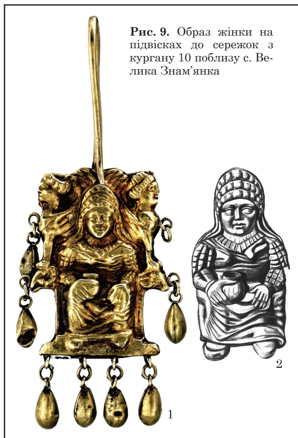
Рис. 9. Образ жінки на підвісках до сережок з кургану 10 поблизу с. Велика Знамянка

рекинуті через плечі, зшиті на спині та з боків, у передпліччі пришиті рукава. Це так званий тунікоподібний крій (Клочко 1992, с. 97).