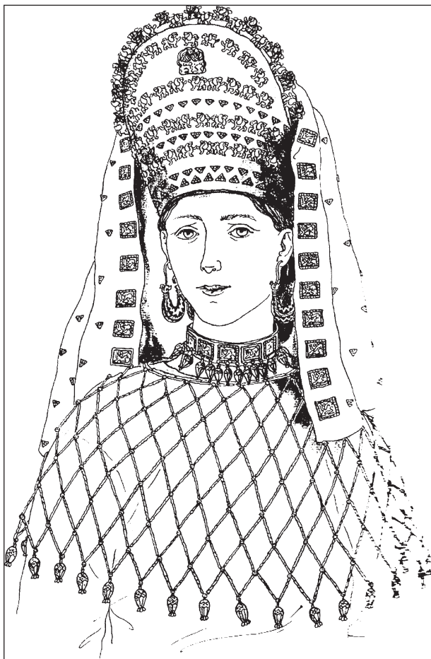
Рис. 10. Реконструкція головного убору за знахідками з поховання 4 у «Великому кургані М. І. Веселовського» (поблизу с. Лепетиха)

зведення відомих скіфських царських курганів (340—315 рр.). Тобто, синдо — меотські і скіфські пам'ятки належать до одного кола. Пластина — прикраса головного убору відповідає характеристикам творів греко-варварського стилю. Як сказано вище, Г. Н. Боровка мав за взірць цю аплікацію, щоб визначити певні параметри для реконструкції конусоподібних уборів. Отже, перед нами золота пластина у вигляді витягнутого трикутника (висота 21 см). На ній у трьох ярусах показано сцени, інтерпретовані як «шлюбний бенкет». Центральний персонаж — жінка в опатному вбранні, на голові якої високий конічний ковпак (рис. 11). Дослідники відмітили збіг деяких деталей у оформленні аплікацій — реальної знахідки та відтвореної на ній: тричленна композиція, дугоподібний нижній край та гострокінцеве завершення. Отже, пластина є ґрунтовною підставою для реконструкції конусоподібного убору, а його зображення — підтвердженням правильності наших уявлень про зовнішній вигляд та параметри шапок зазначеної форми. Хоча поки що трапилась тільки одна знахідка, яка незаперечно належала до декору конічних шапок, але, як свідчать різноманітні документи (образотворчі та археологічні матеріали), такі