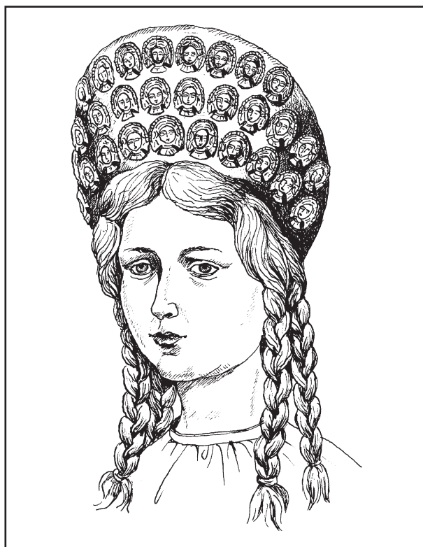
Рис. 5. Реконструкція стефани за знахідками у кургані 1 (1897 р.) поблизу с. Вовківці

Пропоную ще одну версію щодо архетипу, за яким було створено «портрет»: образи деяких еллінських міфічних персонажів у так званих пишних стефанах. Найяскравіші пам'ятки — фігурні посудини із Фанагорії. Йдеться про лекифи, оформлені скульптурними зображеннями Афродіти, Сирени, Сфінкса (Фармаковский 1921, с. 39). За Б. Фармаковським, ці художні витвори є «характерним явищем перехідної епохи V—IV ст. до Р. Х.». Акценти у створених образах зроблено на головні убори та волосся, щоб підкреслити ідею безсмертя та вічного світла (Фармаковский 1921, с. 41). Головний убір, представлений на «вовківецьких» пластинках, можна зіставити зі стефанами, які, ймовірно, в цей час все частіше з'являються в парадних костюмах скіф'янок у Північному Причорномор'ї.