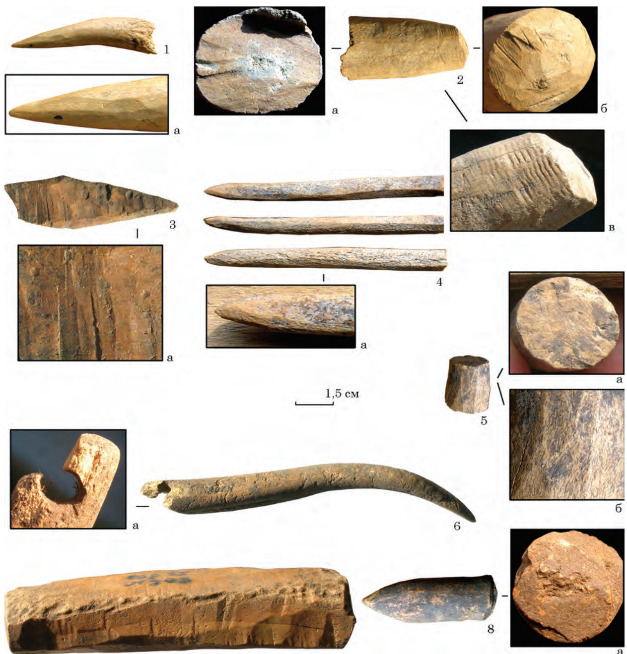
Рис. 5. Мале Городське городище: 4, 6 — знаряддя з рогу, решта — півфабрикати з рогу

Подібні завершення набірних руків'їв з рогу виявлено у Києві (Шовкопляс 1973, рис. 6: 6—8, 12; Івакін та ін. 1998, рис. 104: 7; Сергеева 2011, с. 85, табл. 26: 9), у Теофанії (не опубліковане), на Чорнобильському городищі (Сергеева 2016, с. 155—156, рис. 2: 3, 4) тощо, де вони датуються XII—XIII ст. На півночі Русі, вони з'являються близько середини XIII ст. (Колчин 1982, с. 166). На пам'ятках у Волзькій Булгарії вони побутовували протягом булгарського і ординського часів (Руденко 2005, с. 73, табл. 13). Городські знахідки можуть свідчити, що такі завершення продовжували побутовувати на Русі у післямонгольські часи, що не перечить загальним хронологічним межах їхнього побутовування.