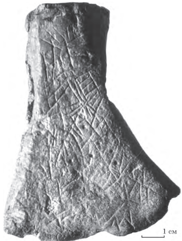
Рис. 4. Мале Городське городище, рогова сокирка з розкопок 1958 р. (за Р. І. Виезжевим)

Рогова сокирка з графіті у вигляді безладної композиції (рис. 4), опублікована Р. І. Виезжевим (Виезжев 1960, рис. 2: 5). Аналогічну виявлено у Любечі на Чернігівщині у 1948 р. (Гончаров 1952, табл. І: 1). Завважимо, що такі сокирки не є прикметними для Середнього