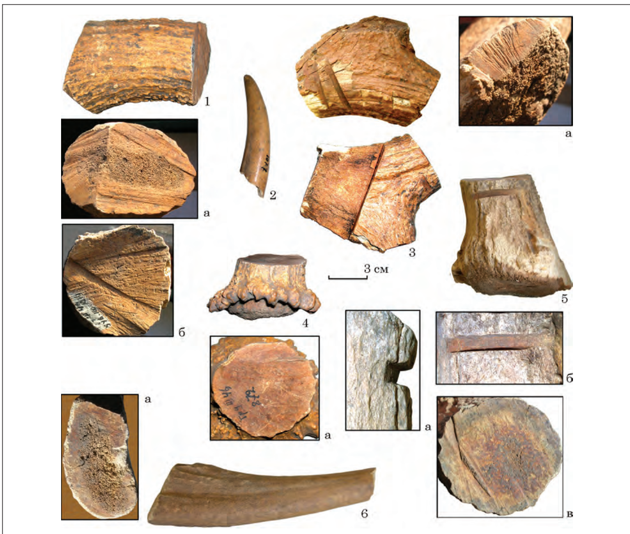
Рис. 6. Мале Городське городище, фрагменти рогів оленя зі слідами обробки

Крім виробів, у колекції є окремі кістки зі слідами обробки, зокрема ребро зі слідами роз-