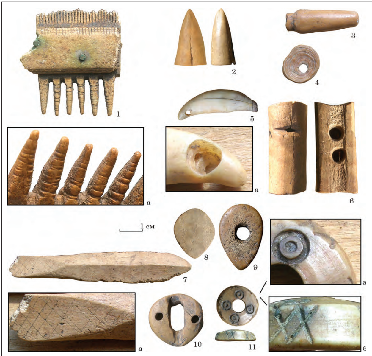
Рис. 1. Мале Городське городище, вироби з кістки й рогу: 1 — гребінь; 2, 7 — наконечники стріл; 3 — застібка (фрагмент); 4, 5 — амулети; 6 — свіщик; 8—10 — завершення набірних руків'їв ножів; 11 — гудзик

Загалом двобічні набірні гребені з кількох частин, скріплених накладками з обох боків, у XII—XIII ст. побутували у широкому ареалі, проте скрізь їх репрезентовано відносно незначним числом екземплярів.