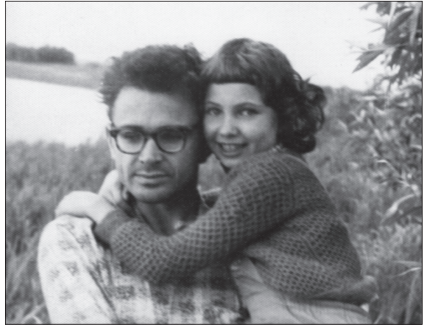
Київ, з донькою Олею, 1965 р.

Цікаво також, як науковець рішуче втручався в переклади та трактування давньогрецьких написів. З-поміж них найперше звертає увагу зовсім інша інтерпретація листа на