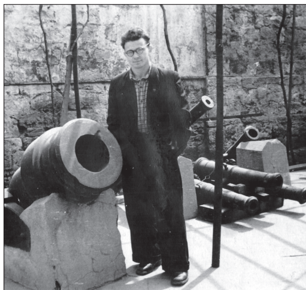
Севастополь, Музей Чорноморського флоту, 1955 р.

Та попри зміну теми аспірант В. А. Анохін вчасно написав дисертацію про монетну справу Херсонеса I—III ст. н. е., основна частина якої була опублікована у престижному науковому журналі «Нумизматика и эпиграфика» (Анохин 1963, с. 3—88). Після успішного закінчення аспірантури він повернувся до Києва і з 1960 р. почав працювати в Інституті археології на посаді молодшого наукового співробітника. В 1964 р. в Москві він успішно захистив дисертацію на здобуття вченого ступеня кандидата історичних наук. 1966 р. В. А. Анохіна було переведено на посаду старшого, а 1986 р. — відповідного наукового співробітника. Вся подальша наукова діяльність ученого у відділі античної археології Інституту археології НАН України, незважаючи на формальний вихід на пенсію, за власним бажанням, у 1999 р., була пов'язана з цією академічною установою. Будучи пенсіонером він продовжував періодично працювати і за контрактом, зокрема, в Старокиївській ар-