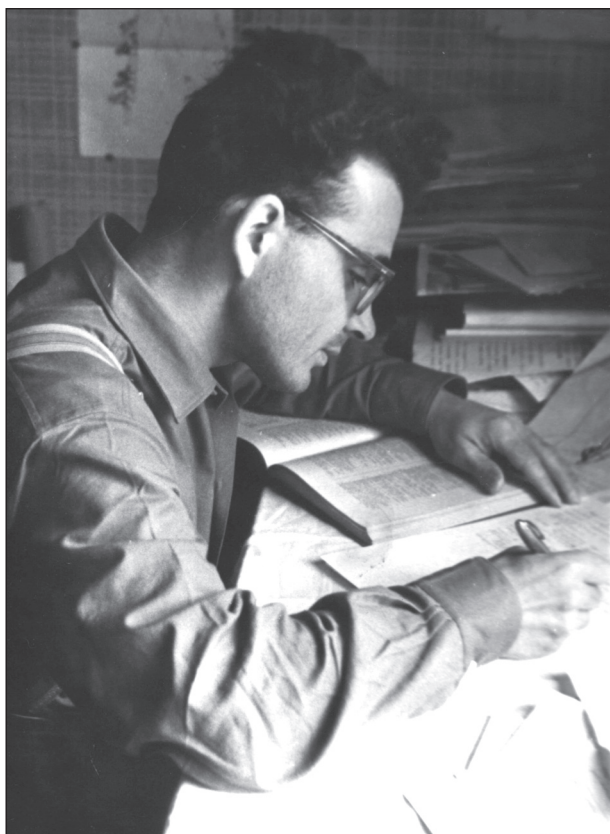
Владілен Афанасійович Анохін (1930—2019)

На сьогодні в Україні немає настільки відомого дослідника монетної справи, яким був і є понині Владілен Афанасійович Анохін. З його ім'ям пов'язано цілу епоху в історії нумізматики античних держав Північного Понту, дослідженню якої він віддав понад 60 років свого