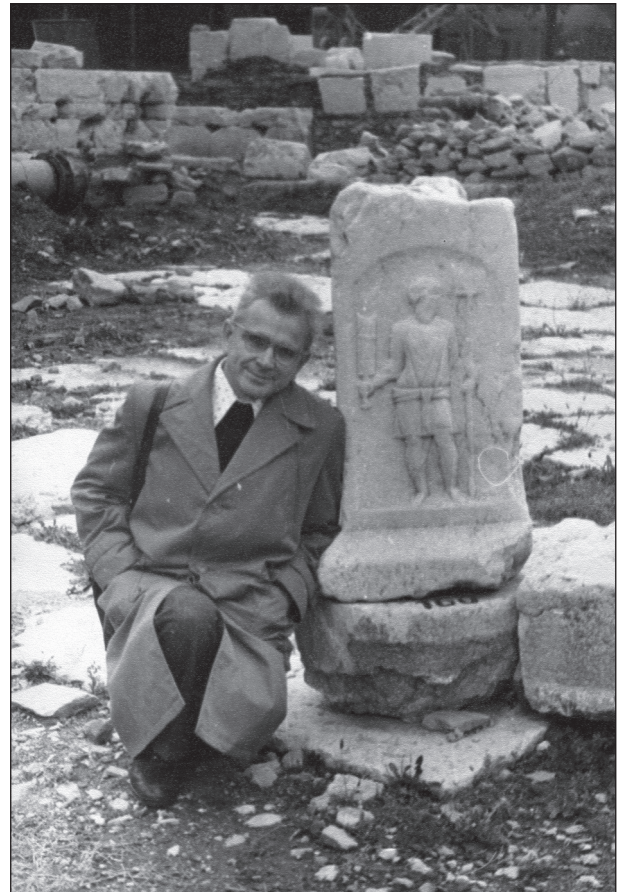
Болгарія, 1970-ті роки

Названими темами не вичерпувалося звернення В. А. Анохіна до інших історичних сюжетів з історії Боспору Кіммерійського. Так, згадка повідомлень Арріана про контакти Александра Великого з європейськими (боспорськими) скіфами на межі 30—20 рр. IV ст. до н. е. (Анохин 1999а, с. 64) та критика російських вчених зумовили його детальніше розглянути і зіставити окремі розповіді Арріана і Курція Руфа про фіксовані ними такі посольські контакти, впевнено доводячи свою інтерпретацію їх текстів з рішучою критикою упереджених висловлювань в статті про Александра Македонського і Боспор Кіммерійський (на за-