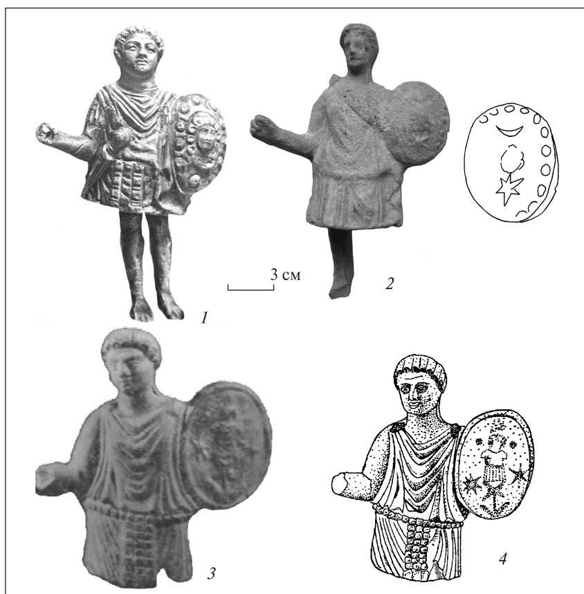
Рис. 1. Статуетки: 1 — Ольвія (за: Леви 1970); 2 — пункт невідомий; 3, 4 — Козирка (за: Бураков 1988; Буйских 1991)

Ще одна статуетка такого самого типу була знайдена в Криму та опублікована в каталозі теракот музею Мартіна фон Вагнера м. Вюрцбург (Schmidt 1994). Зображення на щиті аналогічне описаному. Висота 13,6 см (рис. 3, 1).