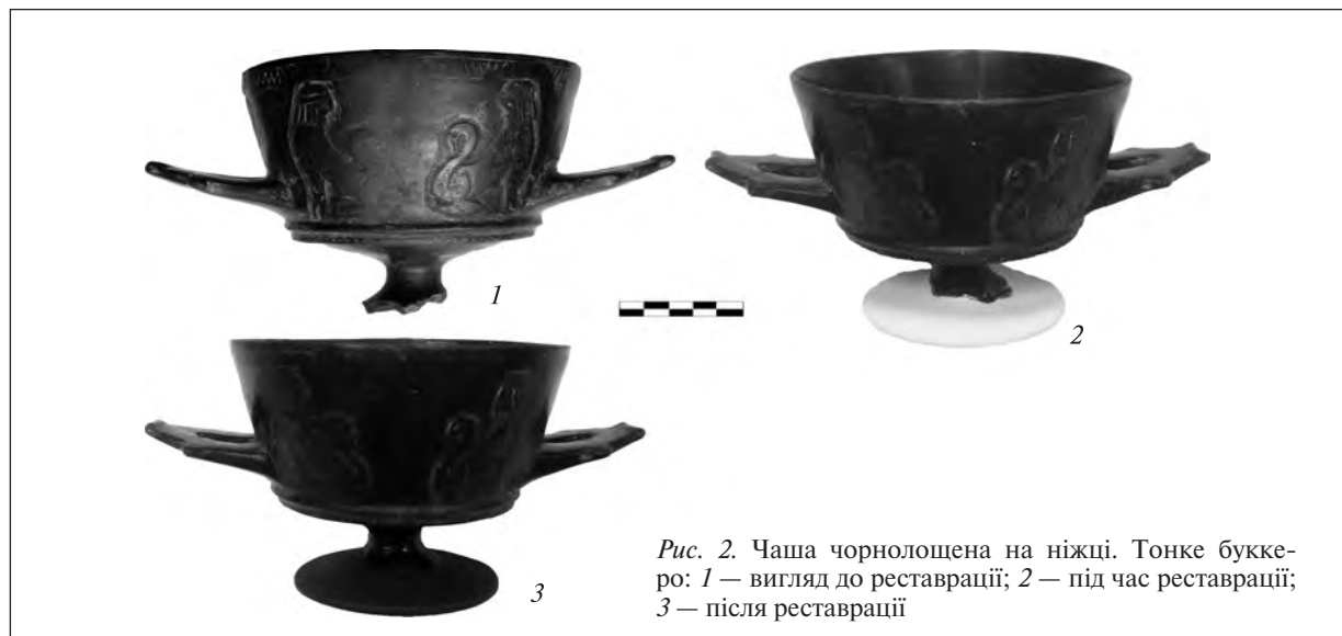
Рис. 2. Чаша чорнолошена на ніжці. Тонке буккоро: 1 — вигляд до реставрації; 2 — під час реставрації; 3 — після реставрації

У січні 1924 р. до інвентарної книги Першого державного музею (нині Національний му-