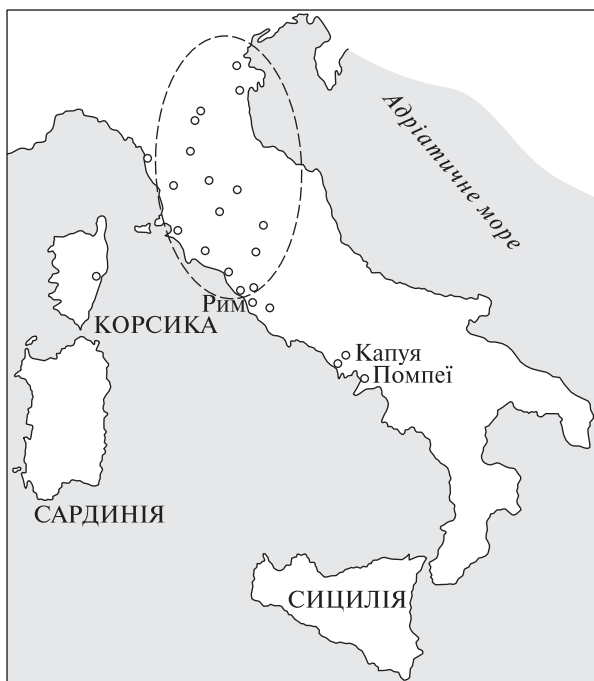
Рис. 1. Карта Апеннінського півострова (пунктиром окреслена Етрурія)

тя, коли Етрурія активно та плідно взаємодіяла з еллінським світом. Такі зв'язки проявляються в багатьох сферах — культурі, релігії, архітектурі та ін. (История искусства 2002, с. 58—59).