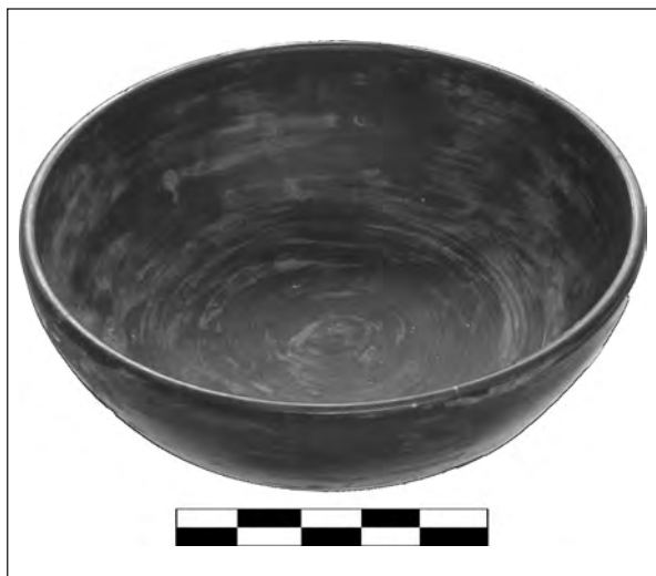
Рис. 7. Миска чорнолощена, найпізніше буккоро

з наказом № 317 Міністерства культури УРСР як таку, що не відповідає профілю історичного музею.