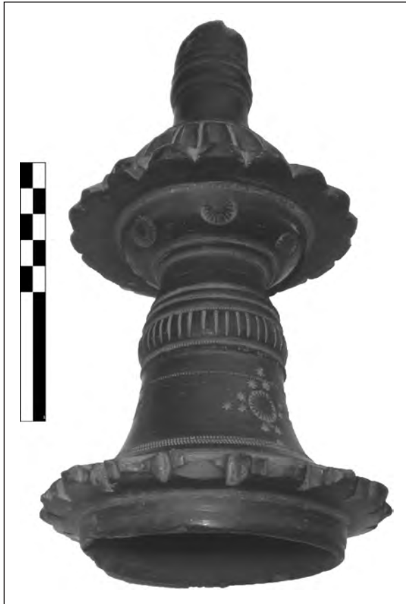
Рис. 5. Покришка культової посудини, середнє буккєро

У 1977 р. рєчї, отриманї вїд Б.І. Ханєнка, були записанї до їнвєнтарної кнїги «Дєржавно-го їсторїчного музею» (нїнї Національний музей їсторїї Українї) пїд шїфром БД. У єтруськїї колекцїї є предмети всїх перїодїв (тонкого, середнього, важкого та пїзнього буккєро).