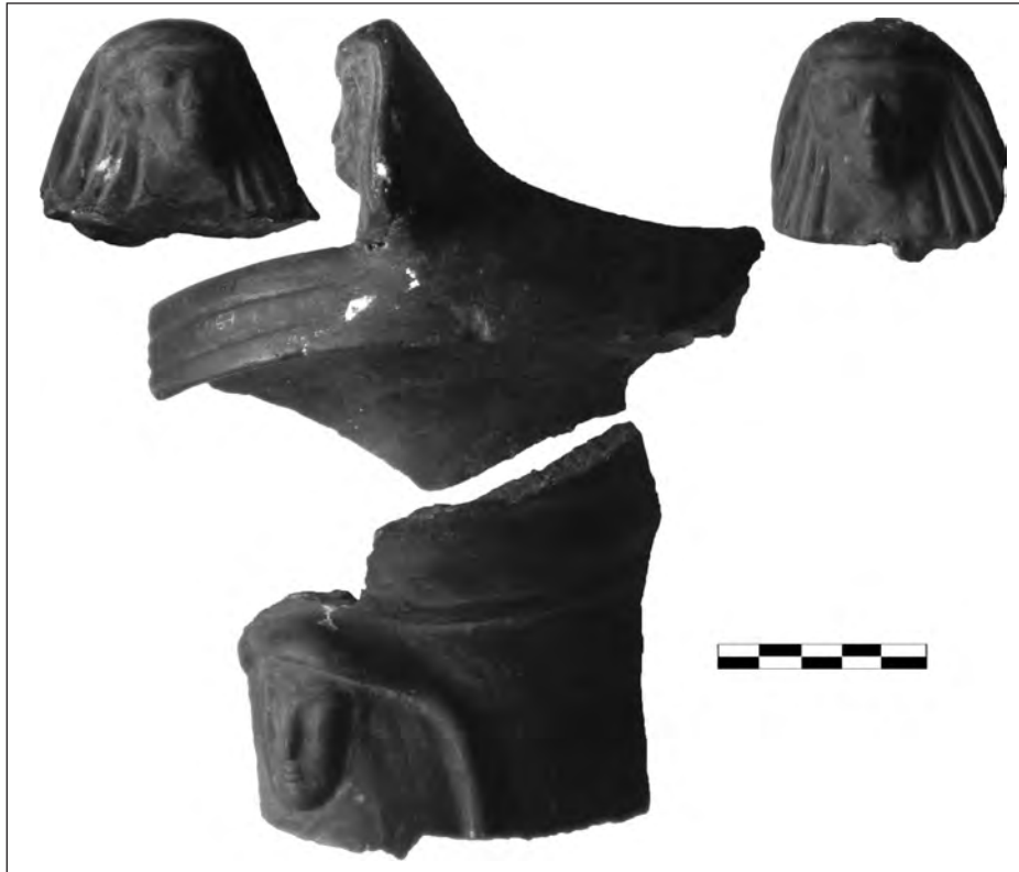
Рис. 6. Фрагменти вінець культової посудини, прикрашені рельєфним зображенням сфінксів

жет (інший кінець штампа) складається з трьох фігур. Перша, що крокує вправо, в короткому одязі, в піднятих руках вертикальна довга жердина (шест). Друга — в довгому одязі, повернута вправо, сидить на складному стільці з перехрестям і в піднятих руках тримає кільцеподібний предмет. Остання постать стоїть у довгому одязі, з подовженою зачіскою, повернута лицем до фігури на стільці, також тримає у випростаних руках кільцеподібний предмет.