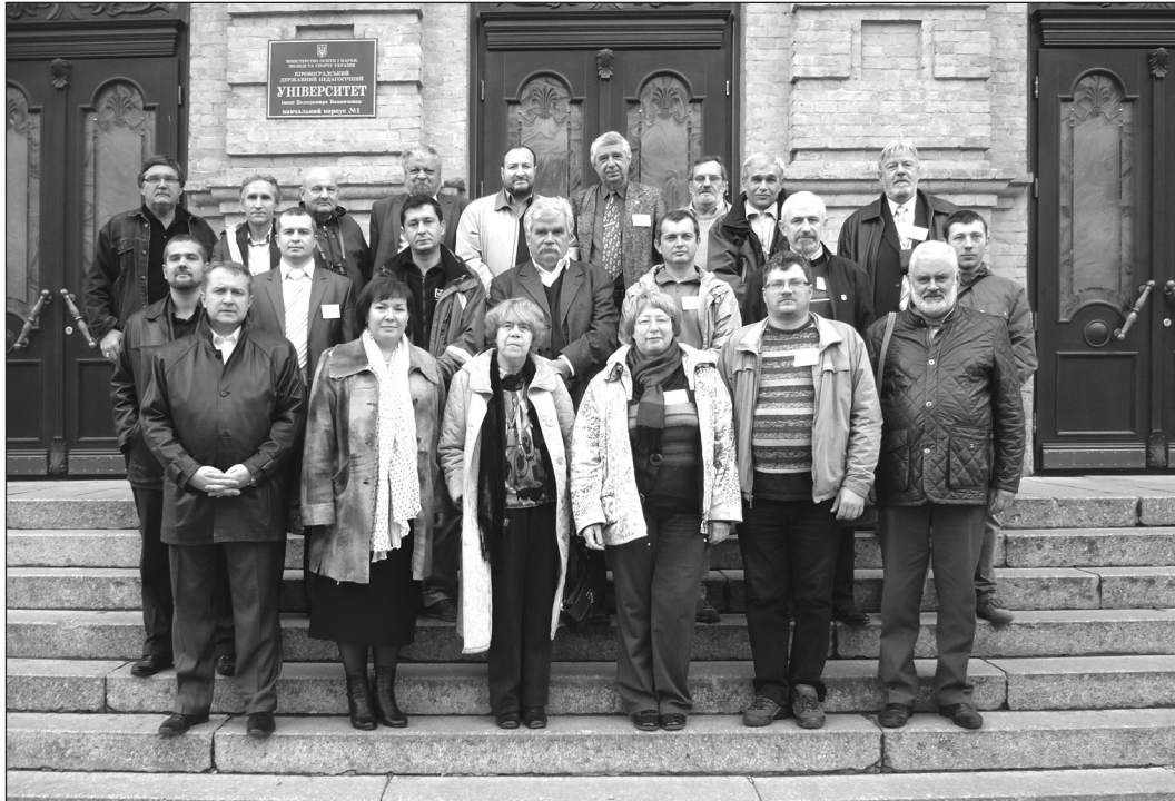
Учасники конференції біля Кіровоградського університету