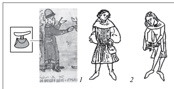
Рис. 2. Зображення середньовічних купців та способи кріплення сумок на поясі: 1 — за Радзивилівським літописом; 2 — за Т.С. Матехіною

Заповнення сумки детально описане П.Г. Гайдуковим і розглядається вченим як грошово-речовий скарб. Дослідник згадує бронзовий виріб у вигляді подвійного пустотілого циліндра різної довжини і діаметра, а також пустотілий свинцевий бочкоподібний предмет. Висловлено припущення, щодо приналежності останнього до писемного дорожнього інвентарю. У тонкому й продовгастому циліндрі, найімовірніше, могли зберігати перо, а в іншому — чорнильні рідини. Предмет у вигляді бочечки міг слугувати чорнильницею. Вищеперераховані речі були складені разом в одному із відділень сумки. У наступних двох відді-