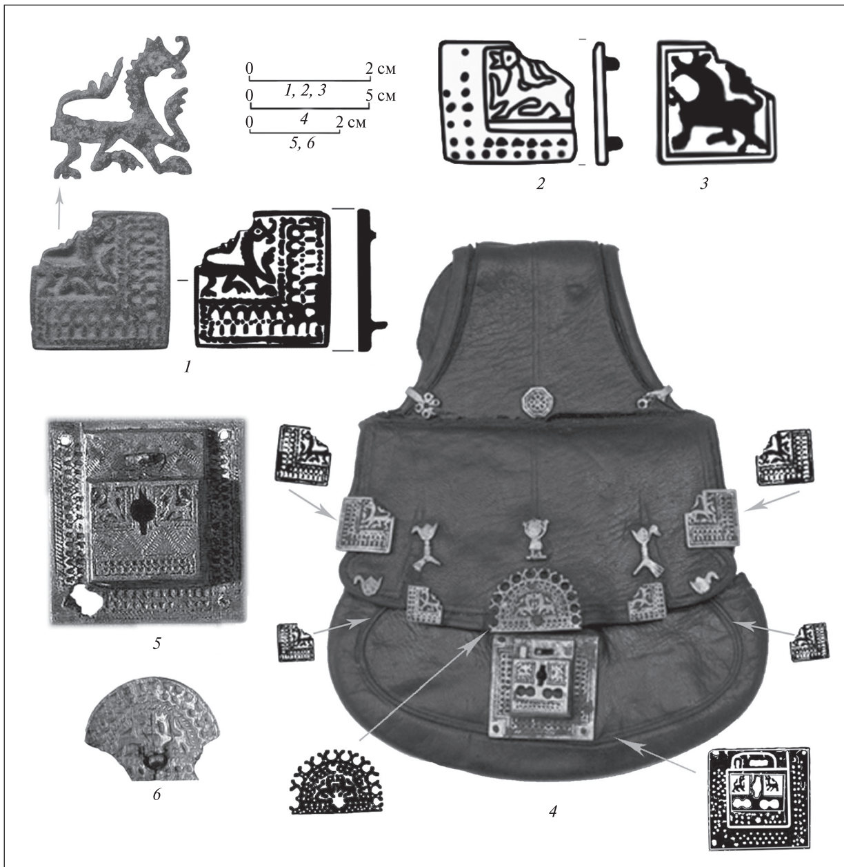
Рис. 1. Пізньосередньовічні литі накладки із зображенням дракона: 1 — фото та промальовка накладки Інв. № В8/5618 з фондів НМІУ; 2 — знахідка із культурного шару XVI—XVIII ст. з м. Дубно у 2007 р. (за Б.А. Прищепю); 3 — Накладка XIV—XVI ст. з Твері (за П.М. Травкіним); 4 — сумка-калита, випадкова знахідка з Новгород (за Т.С. Матехіною), фото з фондів Новгородського історичного музею-заповідника (Інв. № НГМ КП 37669/1); 5 — фото бронзового замка з Туворова горища Ізборська (за В.В. Седовим); 6 — фото бронзової пластини, що закриває лунину замка з Пскова (за В.В. Седовим)

шого декору сумки варто відзначити схожі за художнім стилем наступні складові — личину замка і пластину, що закривала отвір для ключа. Вказані вироби мали аналогічні за стилем зображення пари драконів і такий же криноподібний орнамент.