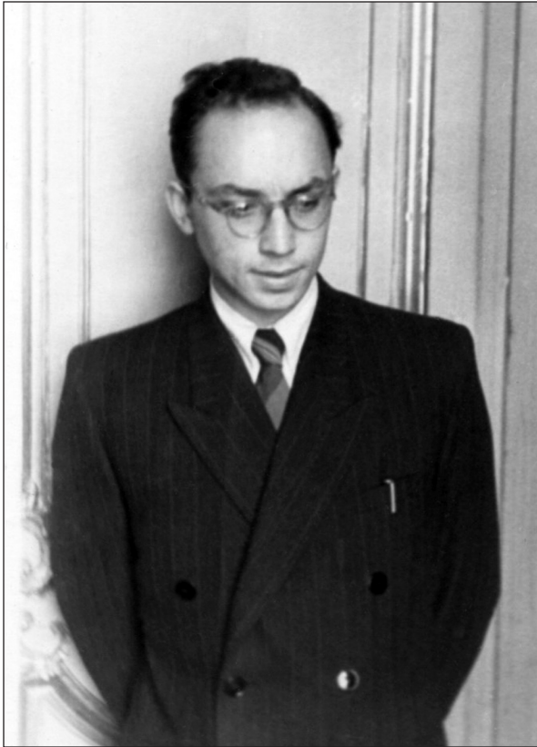
Студент проти академіка Марра (випереджаючи Сталіна), 1949 р.

рік у Нью-Йорку (Клейн 1962; Klejn 1963). Відтоді, налагодивши плідний діалог із західними колегами, дослідник стає таким собі медіатором між радянською археологією та західною. Результатом конструктивної взаємодії став рукопис монографії «Новая археология», запропонований до друку 1976 р., а виданий аж за 33 (!) роки по тому (Клейн 2009), та англomовна «Панорама теоретичної археології» (Klejn 1977). Що, здавалося б, поганого у взаємному обміні науковими ідеями між світами? Та особиста ініціатива у сфері теорії бачилась загрозою для органів контролю. Тому система, увійшовши до фази передсмертних судом, розпочала чергову прополку полів ідеологічних, убезпечуючи їх від потенційно небезпечних інтелектуалів. Мова йде про т. зв. «ленінградську хвилю» зачисток на початку 1980-х. Відтак, у Л. Клейна з'явилась можливість працювати безоплатно «на благо и во славу» радянської науки навесні 1981 р.: в'язниця «Хрести», півтора роки в колонії загального режиму, а по тому — статус безробітного (жовтень 1982 — вересень 1994 рр.). За таких екстремальних умов він набуває статусу класика археології.