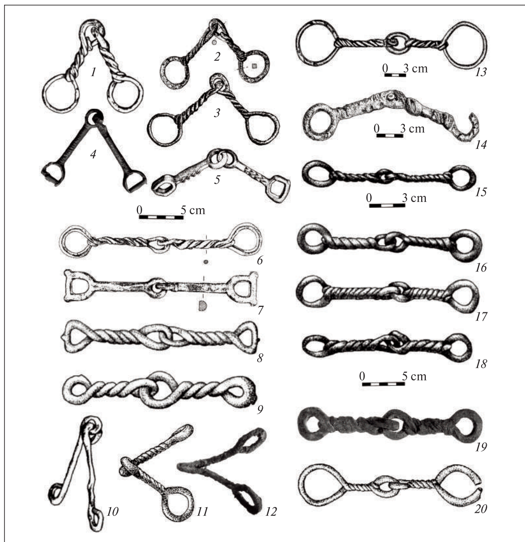
Рис. 2. Удила: 1 — Малый курган в Мильско-Карабахской степи; 2 — Калакент, погребение 47; 3 — Дивалона в Ленкорани; 4 — курган 524 у с. Жаботин; 5 — курган 23 могильника Сакар-чага 6; 6—7 — погребение с конем в Норшунтепе; 8—9 — Богемия, Центральная Европа; 10 — Келермесс, погребение 27; 11 — Кармир-блур; 12 — Хасанлу IV; 13—14 — Мингечаур, курган II; 15 — Anadolu Dedeniyetleri Müzesi, Ankara (раскопки Adilcevaz); 16 — Elazığ Müzesi; 17—18 — Adana Bölge Müzesi; 19 — Хасанлу IV; 20 — Шамхорский могильник, Шемкир. 6—12, 19—20 — не в масштабе. 1—3, 13—14, 20 — Азербайджан; 4 — Черкасская область, Украина; 5 — Дашогузский район, Туркменистан; 6—7, 15—18 — Турция; 8—9 — Чехия; 10 — Адыгея, Россия; 12, 19 — Западно-Азербайджанский остан, Иран (1 — по: Иессен 1965, рис. 10; 2 — по: Nagel, Ştrommenger 1999, tabl. 19, 6.2640d; 3 — по: Mahmudov, Kəsmənlі 1974, tabl II, 7; 4 — по: Рябкова 2014, рис. IV.1, 3; 5 — по: Яблонский 1996, рис. 18, 3; 6, 7 — по: Hauptmann 1983, Abb. 4, 5, 6; 8—9 — по: Медведская 2013, рис. 4, 9—10; 10 — по: Галанина 1997, рис. 4, 10; 11 — по: Медведская 2013, рис. 4, 11; 12 — по: Schauensee, Dyson 1983, fig. 12; 13—14 — по: Асалнов и др. 1959, табл. XXXIX, 2, 4; 15—18 — по: Yıldırım 1987, Şek. 42—44; 19 — по: Schauensee 1989, fig. 11; 20 — по: Асланов 1986, рис. 14)

письменных источниках о скифах (Зенобий 1948, с. 291). В изголовье многих погребенных находились один или два железных наконечника копья, а у правого или левого виска — по одной серьге, или же бронзовые втульчатые наконечники стрел скифского типа, некоторые из них — архаические двухлопастные с ромбическим пером (Асланов 1986, с. 4, рис. 13). В двух погребениях Шамхорского могильника были