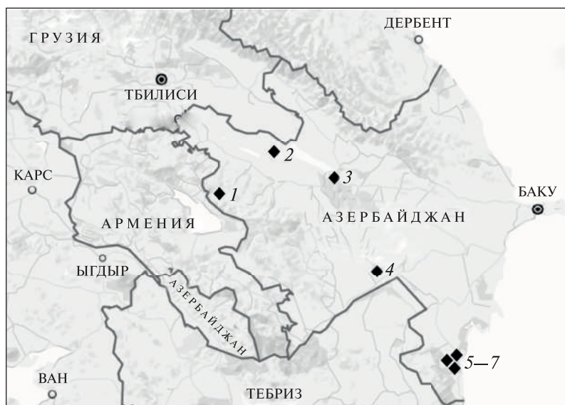
Рис. 1. Карта распространения удил и псалиев: 1 — Калакент, каменный ящик 47; 2 — Шемкир, Шамхорский могильник; 3 — Мингечаурский курган II; 4 — Малый курган; 5 — Дивалона; 6—7 — Узунтепе и Балабур. 1—5 — трехдырчатые псалии; 1—7 — удила с витыми стержнями

2) изготовлением из витого стержня. Как правило, удила этого типа встречаются в одном комплекте с бронзовыми не скрепленными трехдырчатыми псалиями.