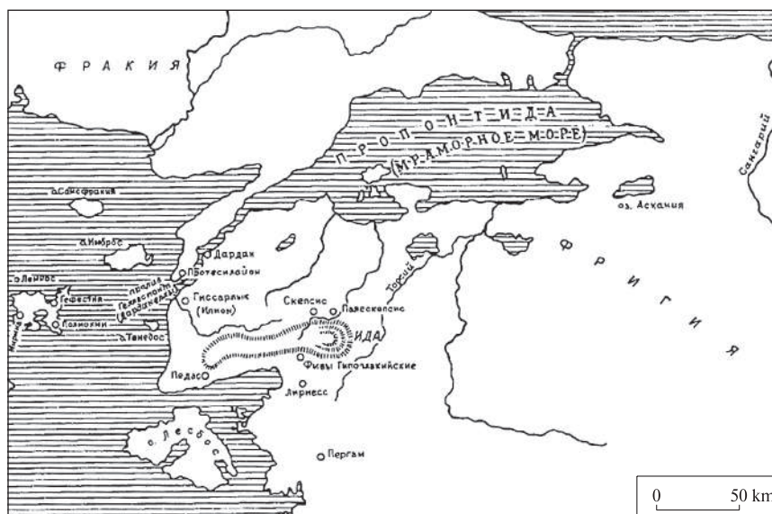
Рис. 1. Карта Троади