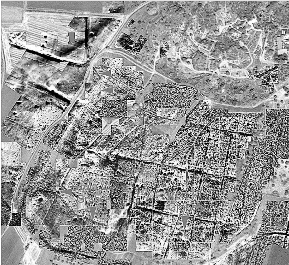
Рис. 3. Нижнє місто Трої

тувань говорить про те, що, швидше за все, прибульці спілкувались індоєвропейськими мовами анатолійської групи. Серед них — хетська.