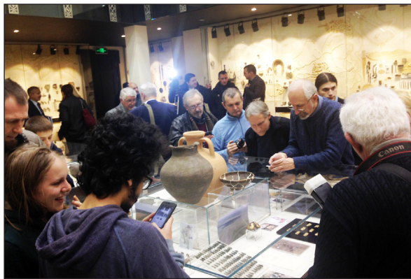
Рис. 5. Презентація знахідок із розкопок археологічного комплексу Більського городища у Музеї археології ХНУ імені В.Н. Каразіна, 2017 р.

У фондах Музею археології Харківського національного університету імені В.Н. Каразіна зберігається найбільша колекція знахідок з Більського городища та його некрополів. Окрема вітрина у новій постійній експозиції Музею, відкрита у 2015 р., розповідає про вагомий внесок вчених Харківського університету у вивчення величезної археологічної пам'ятки. Сьогодні ми маємо змогу демонструвати науковцям та