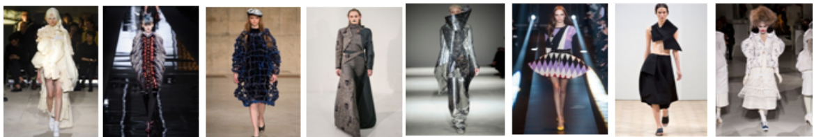
Париж Мілан 2013 рік Лондон Нью-Йорк Париж Мілан Лондон Нью-Йорк