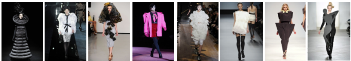
Париж Мілан 2009 рік Лондон Нью-Йорк Париж Мілан Лондон Нью-Йорк