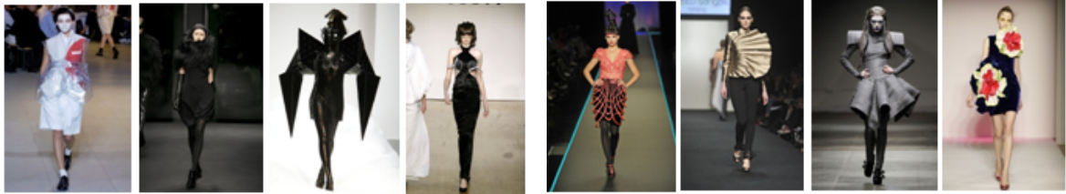
Париж Мілан 2007 рік Лондон Нью-Йорк Париж Мілан Лондон Нью-Йорк