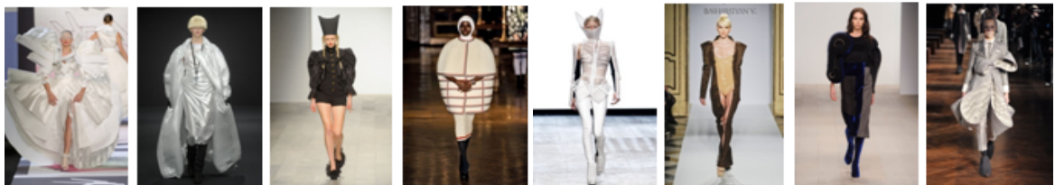
Париж Мілан 2011 рік Лондон Нью-Йорк Париж Мілан Лондон Нью-Йорк