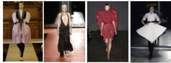
Париж Мілан 2006 рік Лондон Нью-Йорк