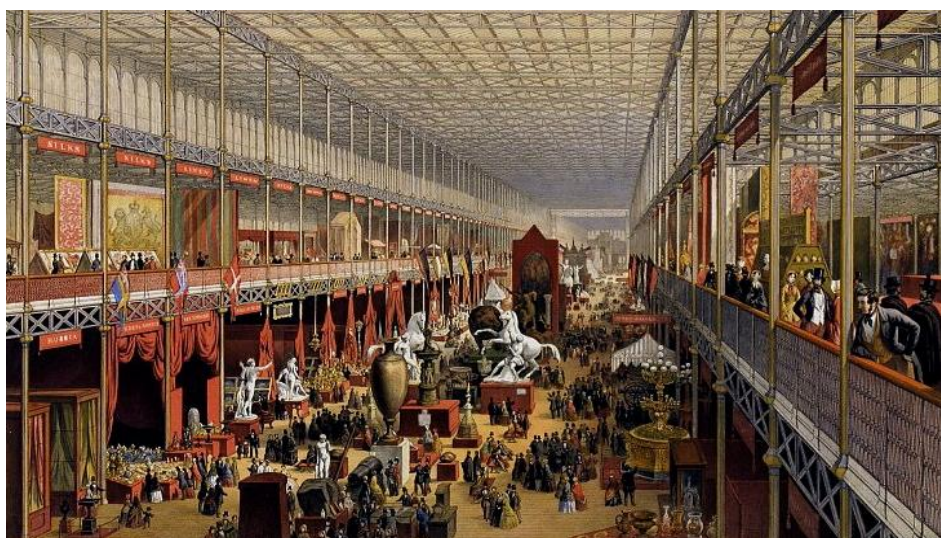
Рис. 2. Кришталевий палац (Crystal Palace), інтер'єри Лондон, Англія, 1851