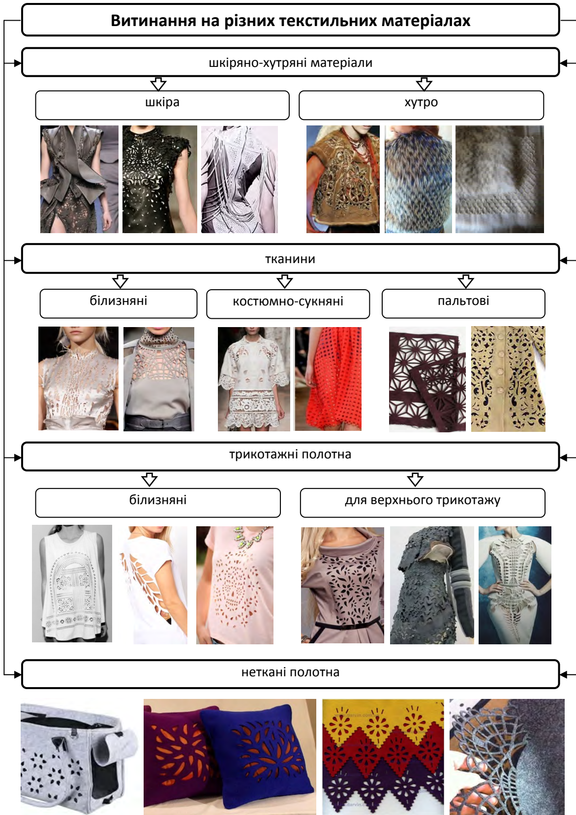
Рис. 1. Текстильна витинанка на різних матеріалах