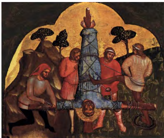
Рис. 1. Распятие святого Петра. Лоренцо Венециано