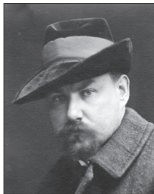
Проф. М.А. Левитський ( https://nmu.ua/wp-content/uploads/2016/08/MECHNYKOVA5.pdf )

У зв'язку з розширенням лікувально-профілактичної мережі та необхідністю укомплектування лікарнями міжрайонних офтальмологічних установ в УРСР розпочалась підготовка лікарів-окулістів на циклах спеціалізації. Також відбулось впровадження циклів удосконалення лікарів-офтальмологів, присвячених найбільш гострим проблемам офтальмології того часу — трахомі, травмам ока, інфекційним захворюванням (тиф, туберкульоз, сифіліс тощо). Продовжилась підготовка з актуальних питань офтальмології дільничних лікарів та