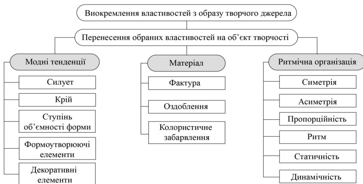
Рис. 1. Виокремлення обраних властивостей з образу творчого джерела

В ході інтерпретації джерела натхнення виділено домінуючі ознаки та характеристики досліджуваного об'єкта з одночасним вилученням менш істотних особливостей та ознак з метою подальшої дизайн-розробки нового матеріалу через створення фактури та колористичного оформлення тканини.