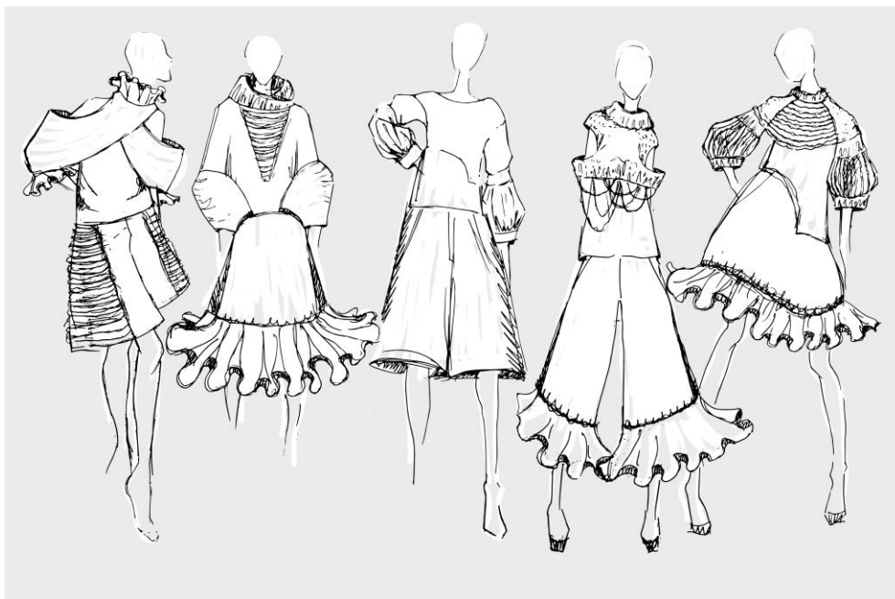
Рис. 4. Фор-ескізи колекції жіночих комплектів з використанням авторських принтів

рисунки спрямовано на формування певних емоційних характеристик образу, які являють собою базу для подальшої роботи. Зображення фор-ескізів колекції жіночих комплектів представлено на рисунку 4.