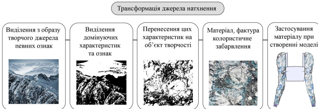
Рис. 2. Етапи трансформації джерела натхнення

На шляху переосмислення джерела натхнення проаналізовано базовий фактичний матеріал «вигляд землі з висоти», спрямований на пошук і виокремлення різноманітних творчих підходів до стилізації об'єкту, визначено його основні риси як високоестетичного матеріалу, так і виробів, зокрема графічні шляхи трансформації властивостей об'єкту-першоджерела в актуальний жіночий комплект (рис. 2).