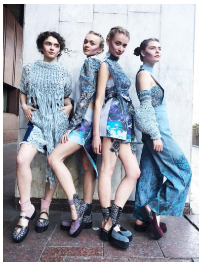
Рис. 7. Виготовлена творча колекція жіночих комплектів з використанням авторських принтів

Висновки. Сформовано концепцію авторської колекції одягу із врахуванням впливу художньо-естетичної цінності творчого джерела натхнення в подальшій розробці моделей. Створено новий художньо-виразний текстильний матеріал із складною об'ємною фактурою та візерунчастими різнокольоровими принтами на основі образу джерела натхнення. Акцентовано увагу на в'язаному трикотажному полотні для блузок із попередньо нарізаних стрічок джинсової тканини з короткою бахромою по зрізам.