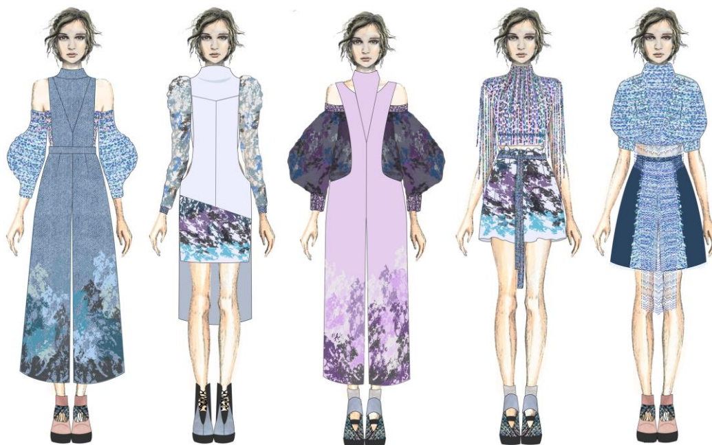
Рис. 5. Творчі ескізи колекції жіночих комплектів з використанням авторських принтів

результаті детального аналізу творчого джерела та виготовлених зразки матеріалів.