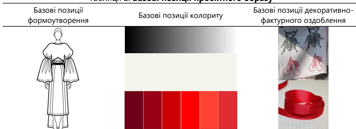
Таблиця 2. Базові позиції проектного образу