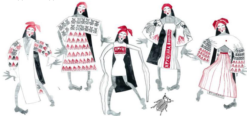
Рис 4. Пропозиції творчо-образного ескізного рішення обраного асортиментного блоку колекції, спроектованої за темою творчого джерела

На рис. 5 наведені фото моделей з різних асортиментних блоків колекції.