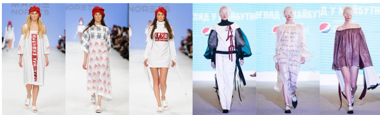
Рис 5. Показ моделей з розробленої колекції у фіналі конкурсів «EPSON DIGITAL FASHION» та «Погляд у майбутнє»