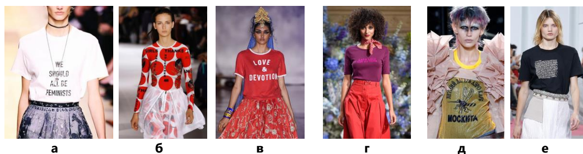
Рис. 2. Приклади використання текстового друку:

Серед таких рішень у декоративному оздобленні одягу дедалі більшої популярності набуває текстовий друк. Футболка, що є своєрідною осучасненою інтерпретацією натільної сорочки, частіше за інші предмети одягу стає полотном для художників і трибуною для висловлювань. Марія Грація Кьурі дебютувала в Dior з гучними закликами до революції і загального фемінізму. Стелла Маккартні – відома захисниця природи, наприклад, продовжує лобювати «зелену» тему. Ашиш Гупта, судячи з принтів, більше стурбований питаннями міграції, любові і відданості. Ванесса Сьюард друкує на футболках філософські фрази з повсякденного життя. Юнія Ватанабе надрукував на футболках кириличні написи. Carven інтригують кількістю тексту: на їхніх футболках надруковані цілі опуси (рис. 2) [10].