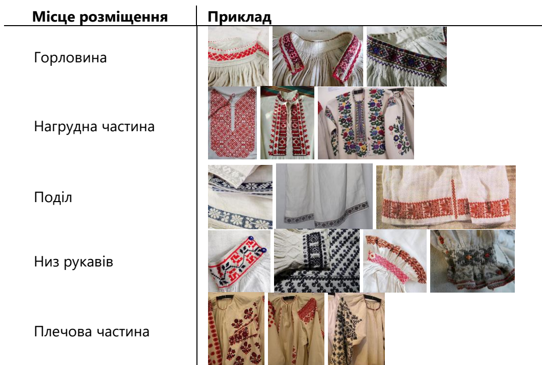
Таблиця 1. Варіанти розміщення орнаменталістики на сорочках

Застосування принципів крою українських сорочок у проектуванні актуальної колекції молодіжного жіночого одягу можна розглядати як продовження тенденції звернення до архаїчного крою одягу різних цивілізацій. Дана тенденція спостерігається у сучасних колекціях багатьох світових брендів.