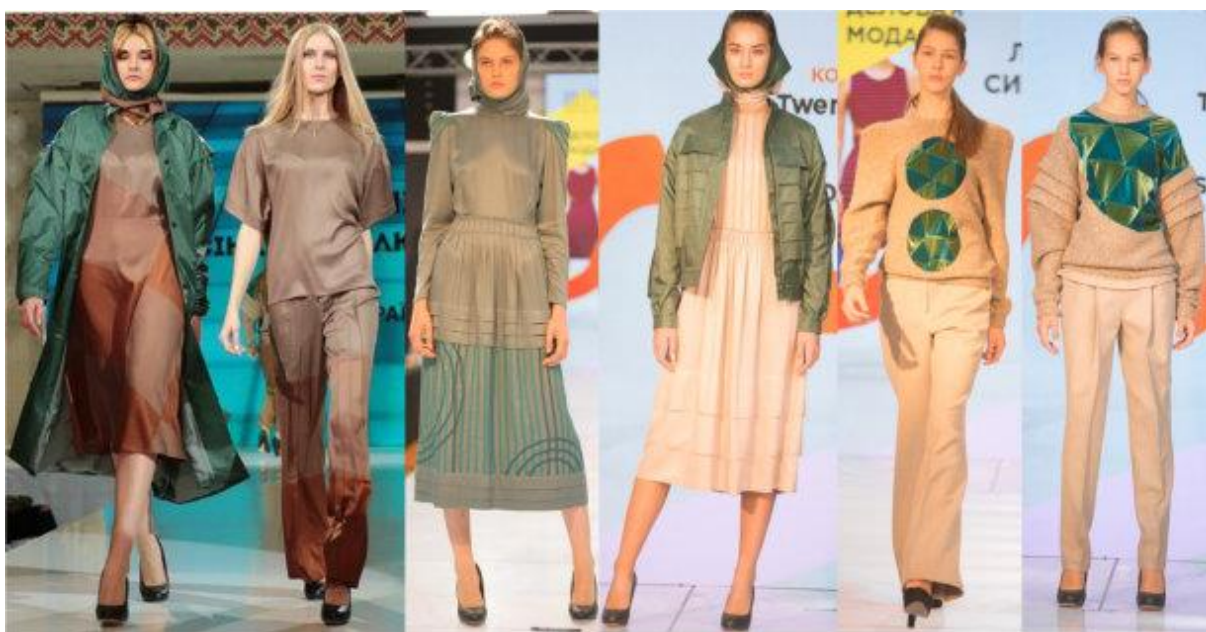
Рис. 6. Фото колекції «Twenty-nine»

«Twenty-nine» (рис. 6), яку представлено на конкурсах молодих дизайнерів. В міжнародному конкурсі молодих дизайнерів «Печерські каштани» (м. Київ, КНУТД, 2017 р.) отримано диплом третього ступеня в номінації Прет-а-порте. У конкурсі молодих дизайнерів «New Fashion Zone» (м. Київ, NFZ community, 2017 р.) здобуто перше місце в номінації «Ділова мода». В міжнародному конкурсі дизайнерів «Мода без кордонів» (м. Кропивницький, МА «Mix models», 2017 р.) отримано диплом другого ступеня за участь в номінації прет-а-порте. Фото готових моделей авторської колекції «Twenty-nine» представлено на рис. 6.