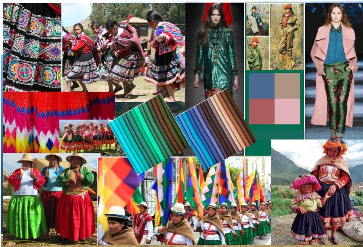
Рис. 1. Колаж джерела натхнення для розробки колекції

Головним етапом при створенні колекції є визначення творчої концепції, що несе в собі емоційну складову костюма та певний естетичний характер. Її суть впливає на цілісність художнього образу та його гармонійне сприйняття. Джерелом натхнення для дизайн-проектування колекції жіночого одягу став перуанський національний костюм, окремі ознаки якого були використані при проектуванні виробів (рис.1).