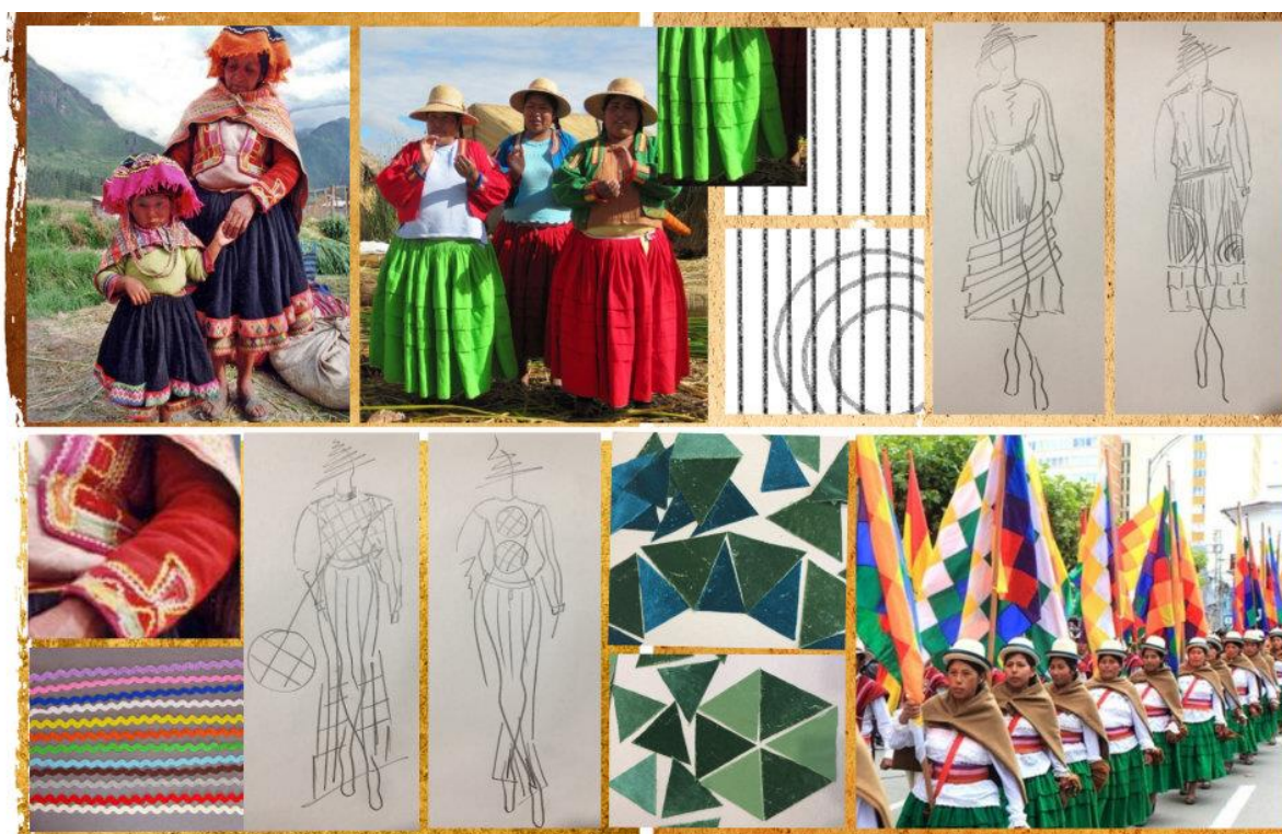
Рис. 3. Трансформація творчого джерела

Важливим моментом при розробці одягу є визначення його призначення і асортименту [8]. Колекція повинна бути функціональною, практичною та адаптованою до різних сфер використання. Вона має містити широкий асортимент виробів, які легко комбінуються між собою та є взаємозамінними, що дасть змогу підібрати одяг для роботи в офісі, відвідування ділових зустрічей, дозвілля або повсякденного носіння. Тому, з метою створення цілісного сприйняття колекції одягу використано гармонійні за кольором та фактурою матеріали. Оскільки проектується діловий одяг, перевагу надано коричневій палітрі в поєднанні з зеленим та синім. Серед асортименту тканин обрано платтяну штапельну тканину та еластичну сітчасту тканину для суконь, костюмну тканину для штанів, трикотаж та оксамит для светрів, плащову тканину для плаща та куртки. Для розробки колекції жіночого одягу використано комбінаторний метод проектування, в основі якого лежить