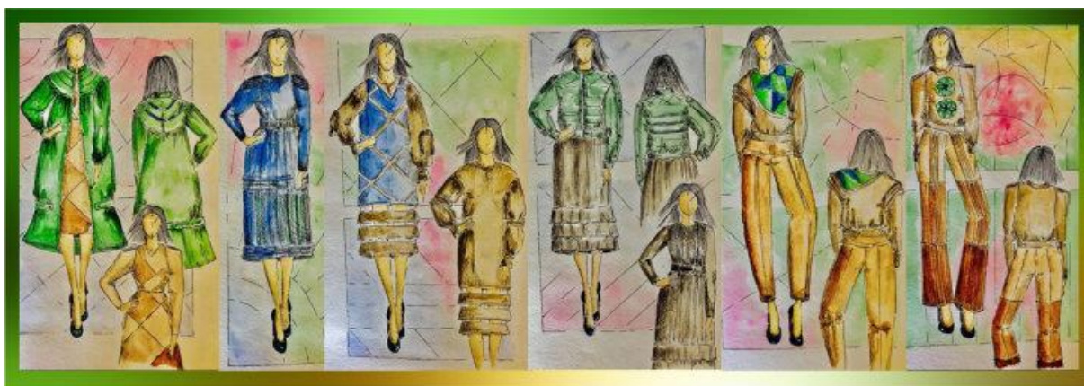
Рис. 4. Ескізи колекції жіночого одягу з використанням техніки печворк

В процесі творчої діяльності не завжди чітко сплановано застосування конкретних методів проектування, адже процес творчості є складний, багатовекторний та інколи суперечливий. Тому в ході роботи, орієнтуючись на поставлені цілі, завдання, на основі дослідження, виділено три основних методи виготовлення одягу з використанням техніки печворк (рис. 5).