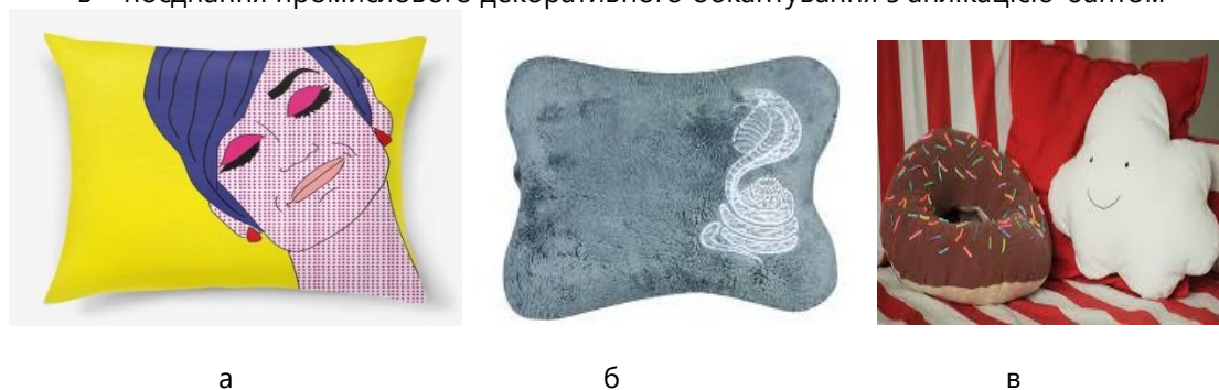
Рис 4. Різновиди подушок оформлених за стилем: а – єдиний стиль (сучасний); б – комбінований (контемпорарі та єгипетський); в – авторський (у формі бублика та хмаринки)