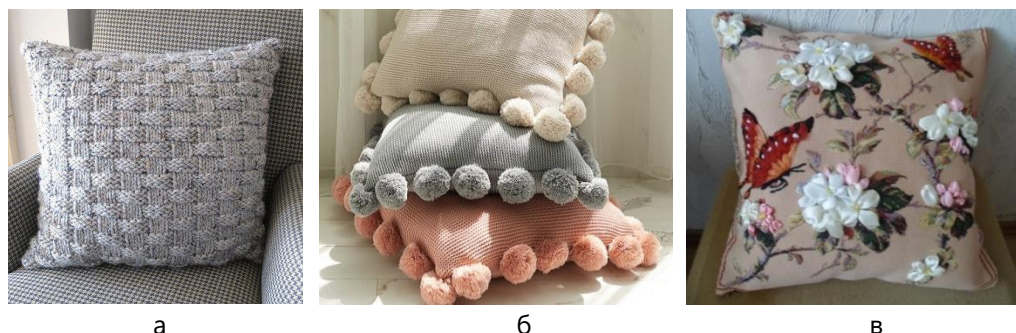
Рис. 5. Приклади декоративного оздоблення подушок: а – монодекорування в'язанням; б – декор з помпонами; в – мультидекорування – поєднання вишивки та стрічки