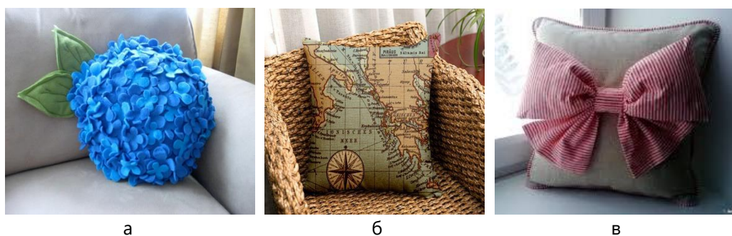
Рис. 3. Приклади декоративних подушок за способом виготовлення: а – «Квітка» аплікація зроблена вручну; б – машинний принт «Карта світу» промислового виробництва; в – поєднання промислового декоративного обкатування з аплікацією-бантом