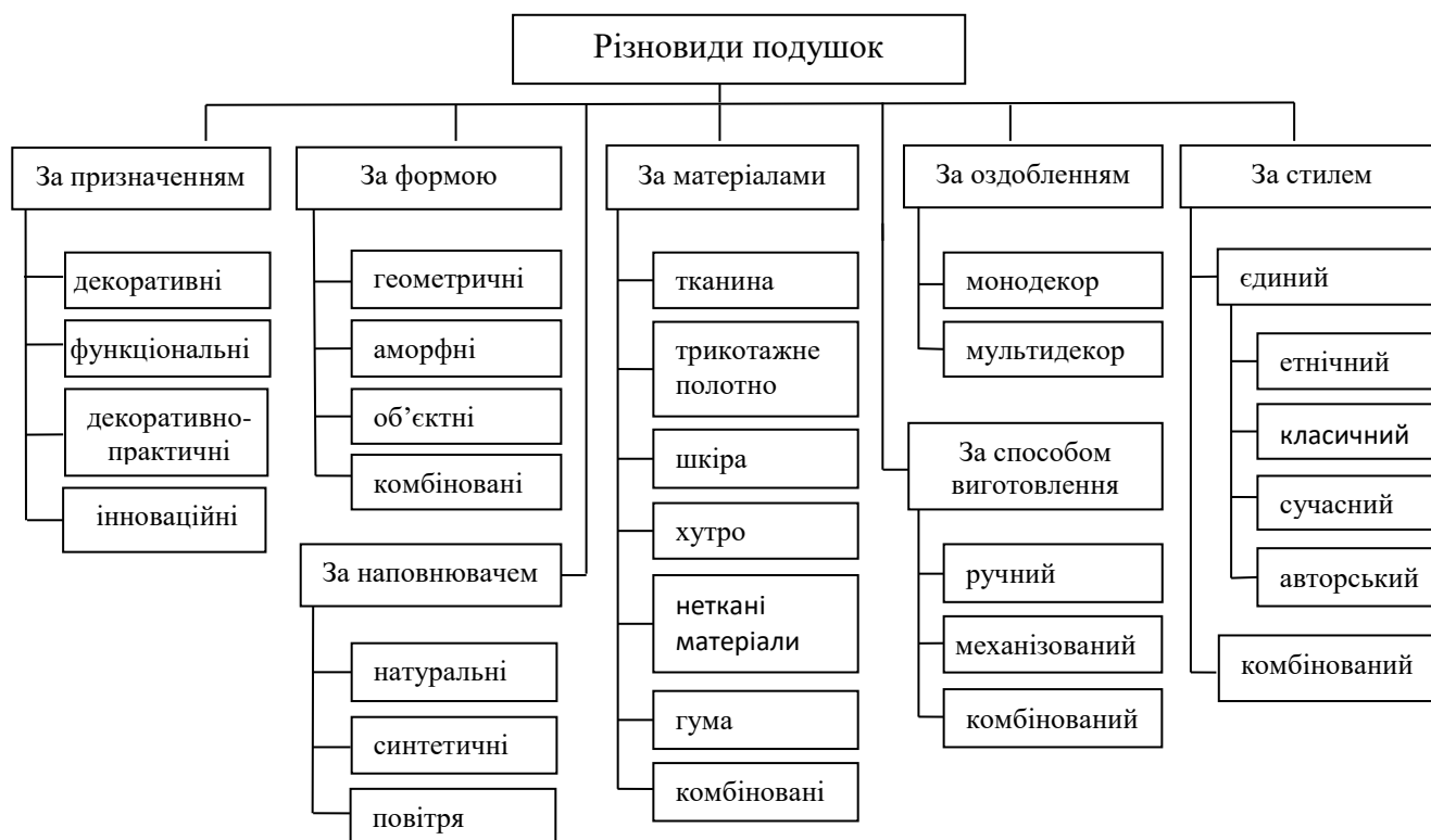
Рис. 2. Систематизація різновидів подушок

Водночас, окрему увагу варто приділити інноваційним виробам з гаджетами, що мають додаткові функції: