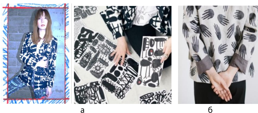
Рис. 3. Фрагменти авторських принтів брендів: а – Factiveface; б – IstiHome

найвиразніших пропорцій, ритму, симетрії, динамічності.