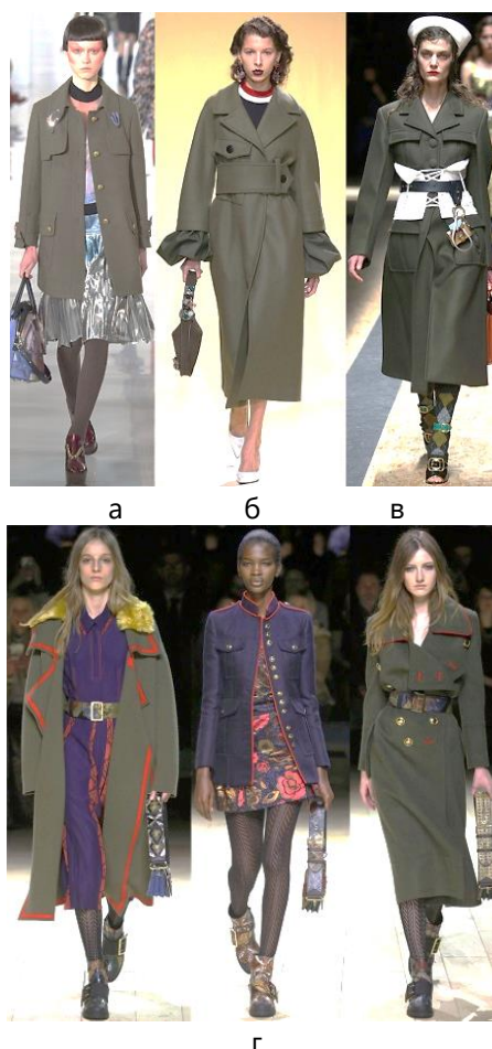
Рис. 1. Приклади колекцій одягу в стилі мілітарі сезону осінь-зима 2016/2017: а – Maison Margiela; б – Marni; в – Prada; г – Burberry

Важливим етапом в дизайн-проекуванні є аналіз модних тенденцій та стилю через призму історії з метою передачі цілісності колекції. Серед найвідоміших брендів, які представляли свої колекції у стилі мілітарі, варто відмітити модні будинки Maison Margiela, Marni, Prada, Burberry. Моделі колекцій дизайнерів представлено на рис. 1. З метою виділення характерних ознак авторської колекції створено творчій колаж. При роботі над колекцією використано фотографії жінок у одязі з елементами військової форми, що стало джерелом натхнення [3]. Творчий колаж зображено на рис. 2.