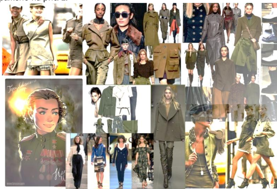
Рис. 2. Творчий колаж для розробки колекції жіночого одягу «Незламна»