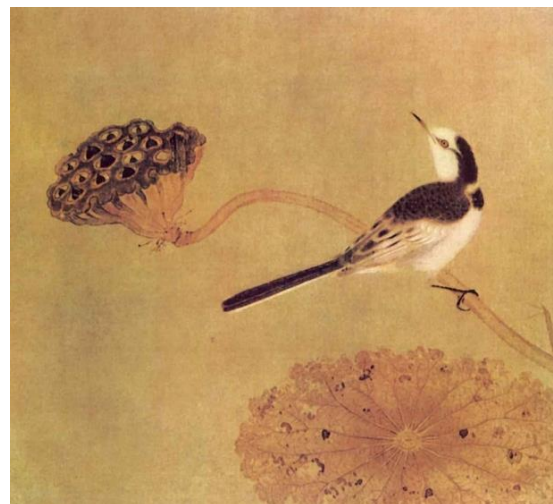
Іл. 2. Ма Сінцу. Птах на лотосі. XII ст.