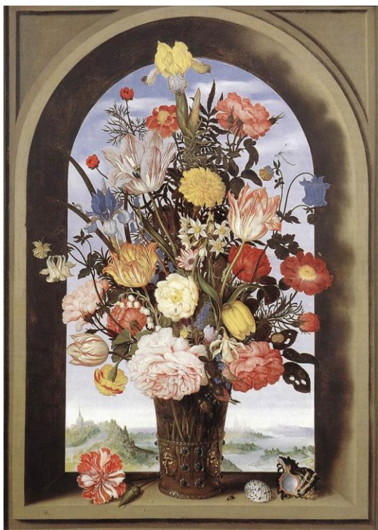
Іл. 3. Амброзіус Босхарт. Букет в арочному вікні. 1618 р.