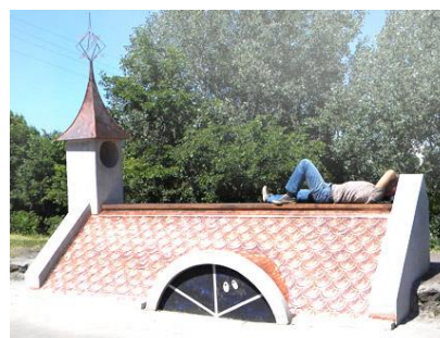
Рис. 10. Лава-скульптура «На даху» (дизайнер О. Залевський, 2011)