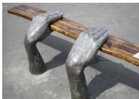
Рис. 9. Лава-скульптура «Руки» (дизайнер Л. Літківська, 2011)