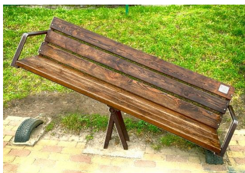
Рис. 5. Лава-гойдалка «Баланс» (дизайнер А. Тан, 2011)