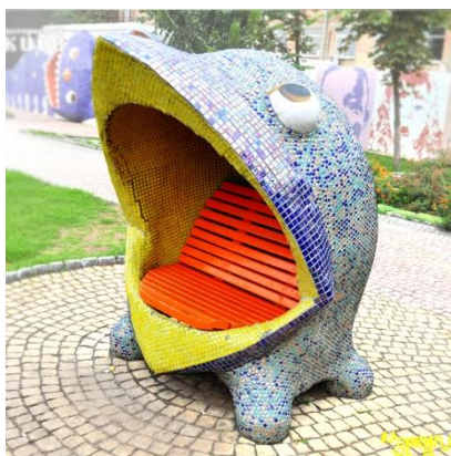
Рис. 11. Стилзовані лави для сидіння (скульптор К. Скрытущий, 2009)