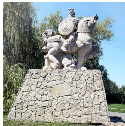
Рис. 12. Скульптура князя Святослава (скульптор О. Пергаменщик, 2004)