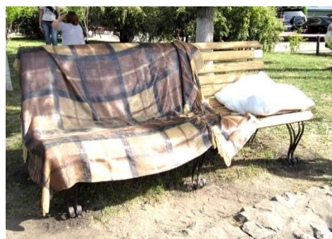
Рис. 6. Лава-скульптура «Наче вдома» (дизайнер В. Кузнецов, 2011)