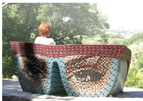
Рис. 7. Лава-скульптура «Окуляри» (дизайнер С. Данчинов, 2011)