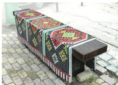
Рис. 8. Лава-скульптура «Килим» (дизайнер Л. Пустовіт, 2011)