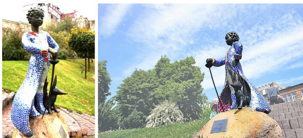
Рис. 1. Мозаїчна скульптура «Маленький принц» (скульптор К. Скритуцький, 2010)