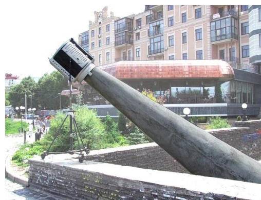
Рис. 4. Інсталяція «Форма світла» (художник Ж. Кадірова, 2011)

Натомість формально-пластично вона відповідає естетичним вимогам образотворення щодо творення прекрасного. Ідейно робота Ж. Кадірової звертає до взаємозв'язків з минулим, в тому числі мистецьким, асоціативно – до поп-арту, мінімалізму, супрематизму,