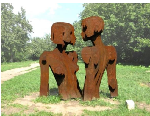
Рис. 3. Композиція «Ріка-Любов» (дизайнер О. Лідаговський, 2009)