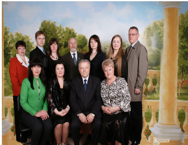
Колектив кафедри ендокринології з курсом ЛФК і СМ, 2009 рік