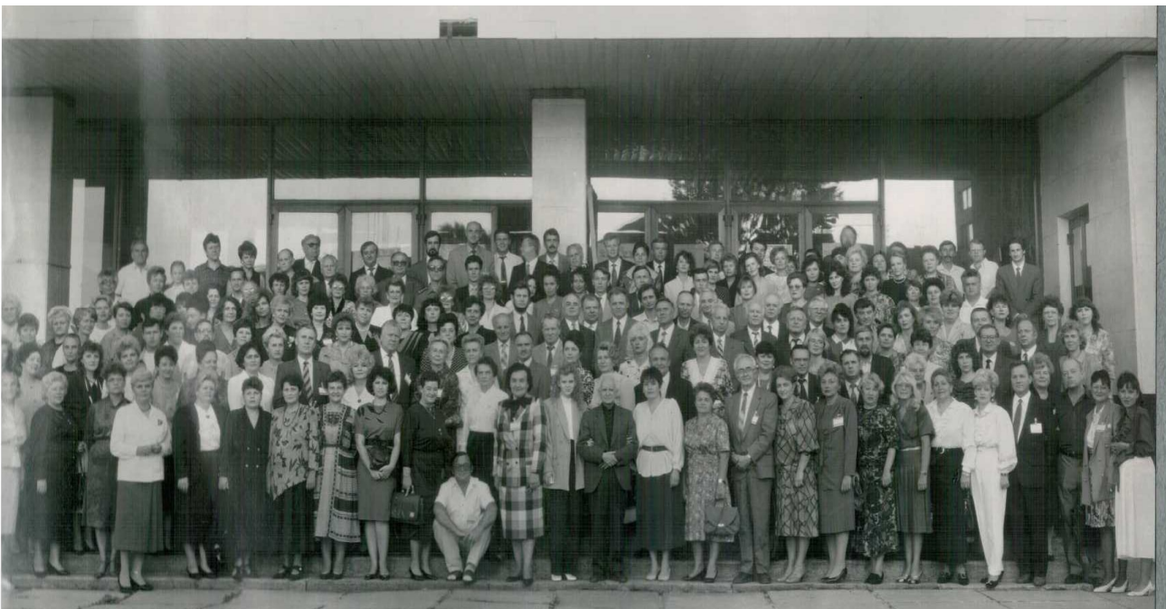
У з'їзд ендокринологів України 13-16 вересня 1994 р., м. Івано-Франківськ