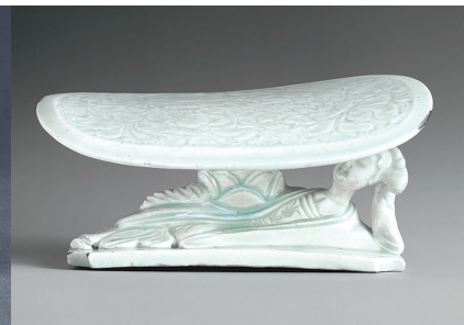
Рис. 8. Подушка. 1127–1279 рр.

декорований посуд [12, 25–26]. Поширеним було нанесення на вироби, призначені для оснащення імператорського побуту, написів, які позначали або функцію предмета, або ж місце його розташування [12, 21]. Така практика, з одного боку, захищала імператорське майно, а з іншого — сприяла чіткому функціональному розподіленню предметів.