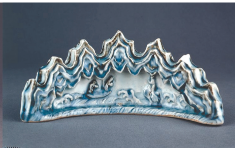
Рис. 7. Підставка для пензлів у формі гірського пасма. XVI ст.