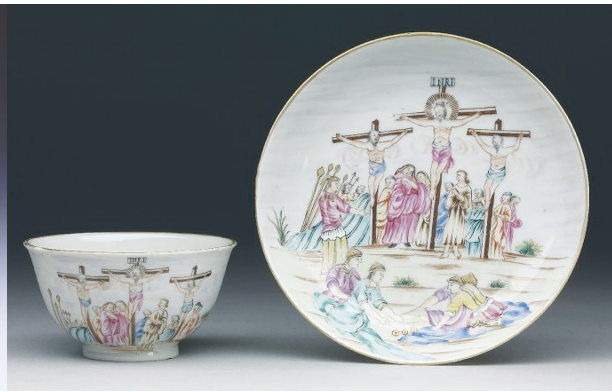
Рис. 5. Чашка з блюдцем із зображенням Розп'яття. 1740–1760 рр.