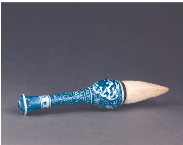
Рис. 6. Пензель із фарфоровою ручкою. 1573–1620 рр.