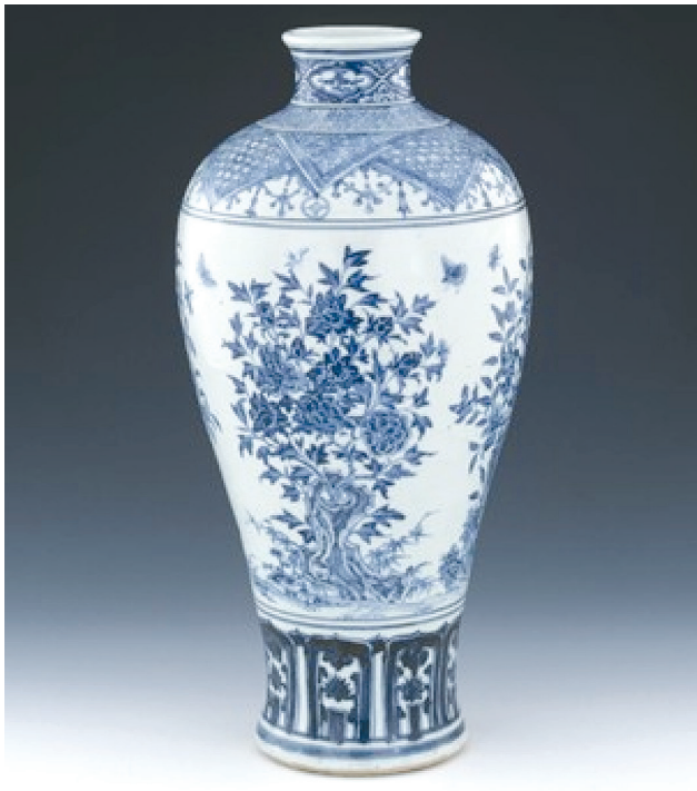
Рис. 1. Ваза мейпін. 1465–1487 рр.