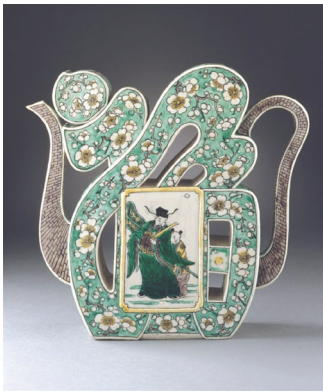
Рис. 3. Глечик у формі ієрогліфа «щасття». 1505–1566 рр.