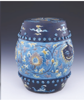
Рис. 4. Табурет. 1662–1722 рр.