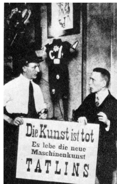
Рис. 4. Георг Грос (праворуч) та Джон Хертфілд. Напис на плакаті: «Мистецтво померло — хай живе нове виробниче мистецтво Татліна!»