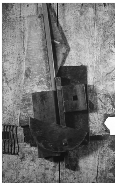
Рис. 3. Володимир Татлін. Бандура (Жовто-блакитний рельєф). 1914–1915 рр.