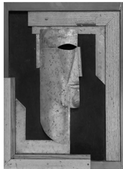
Рис. 2. Василь Єрмилов. Портрет художника Олексія Почтенного. 1924 р.