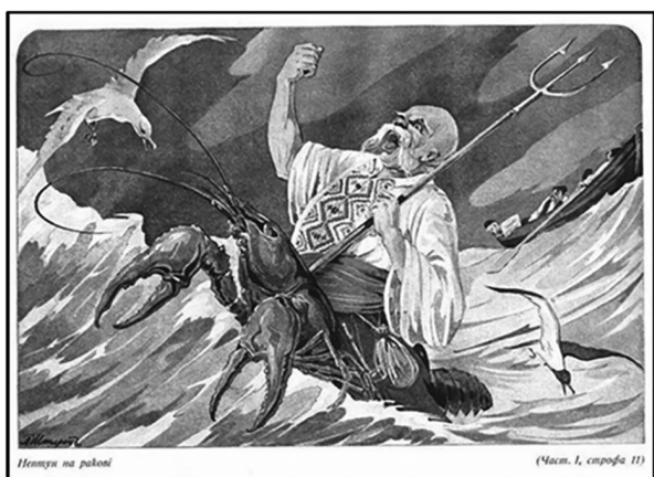
Рис. 1. А. Штірен. Ілюстрації до поеми «Енеїда» І. Котляревського, 1922 р.