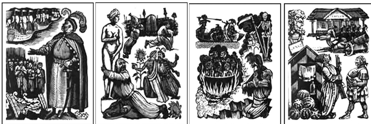
Рис. 2. М. Ушаков-Поскочин. Ілюстрації до поеми «Енеїда» І. Котляревського, 1943 р.

Відомий мистецтвознавець М. Лазарев з цього приводу писав: «Композиції Бісті вписуються