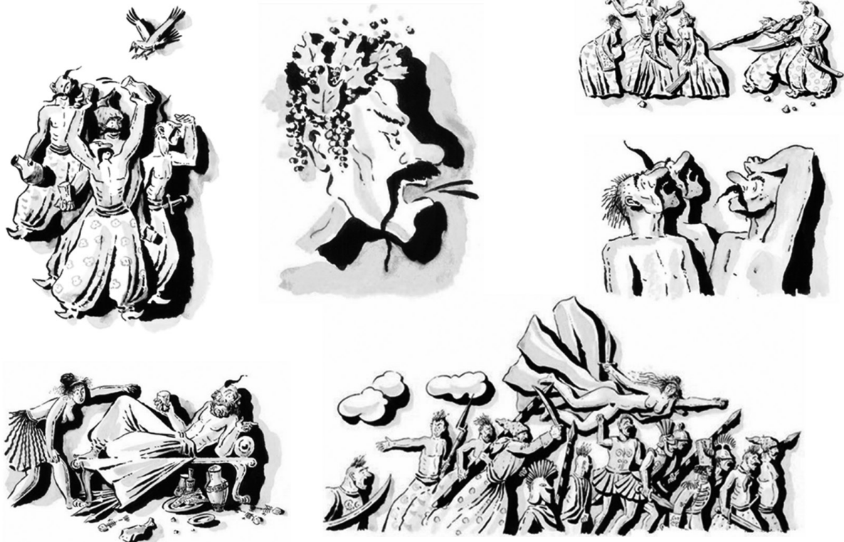
Рис. 4. Д. Бісті. Ілюстрації до поеми «Енеїда» І. Котляревського, 1971 р.