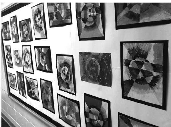
Рис. 3. Тимчасова виставка дитячих робіт, об'єднаних кольоровим паспорту та окремою площиною на стіні з рельєфним обрамленням