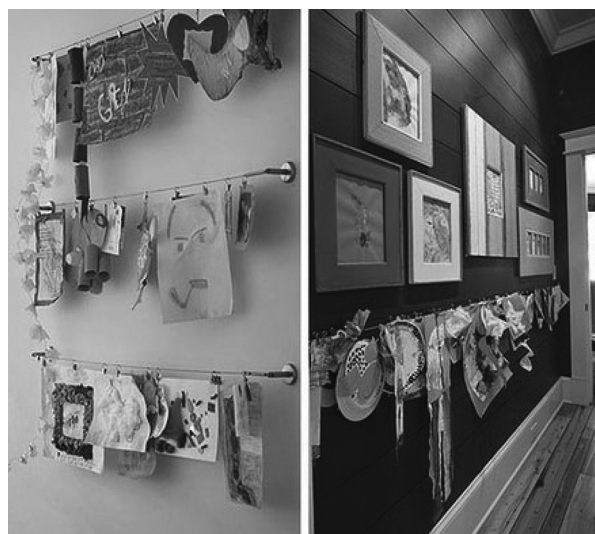
Рис. 2. Використання нетрадиційного оформлення у виставковій діяльності дитячих творчих робіт в інтер'єрах спеціалізованих закладів для дітей, що потребують соціальної реабілітації