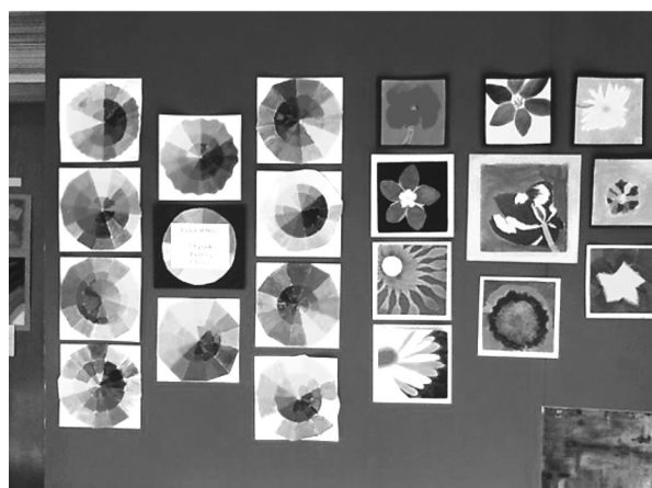
Рис. 4. Тематична експозиція дитячих робіт з використанням активного за кольором фрагменту стінової панелі