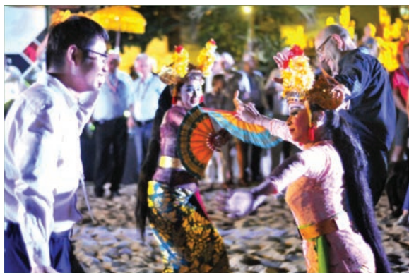
Під час прийому

МІЗ промисловість може отримати інноваційне рішення проблеми.