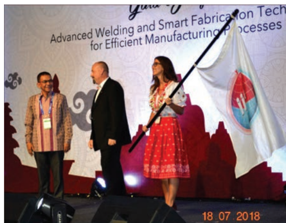
Прапор МІЗ передано Словаччині

Дуже часто виникає питання, а що дає Україні чи окремій установі участь в роботі міжнародної організації, чим виправдані, якщо можна так сказати, кошти, що вкладає держава для участі в діяльності цієї міжнародної організації. На думку українських учасників 71 щорічної Асамблеї МІЗ,