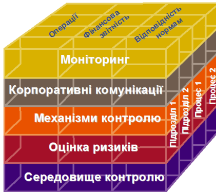
Рис. 3 – Куб COSO

представлена у вигляді кубу, звідки вона і дістала свою назву “COSO Куб” (рис. 3).