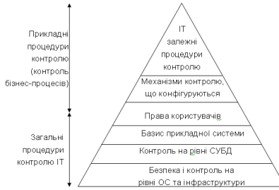
Рис. 2 – Взаємозв’язок процедур контролю

представлена у вигляді кубу, звідки вона і дістала свою назву “COSO Куб” (рис. 3).