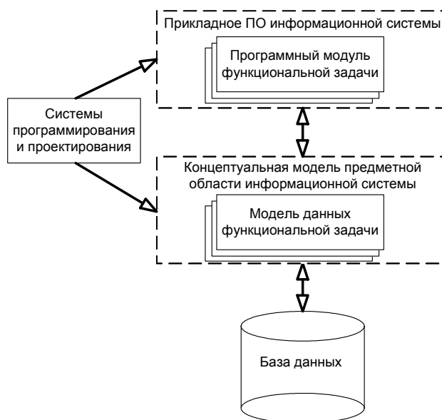
Рис. 2. Статическая структура построения информационной системы

3) физической модели информационных массивов данных - уровень структур базы данных.