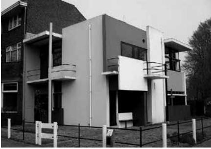
Герріт Рітвельд. Будинок Шредер. Утрехт. Нідерланди. 1924 р