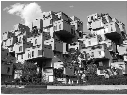
Моше Сафді. Житловий комплекс HABITAT-67. Монреаль. 1967 р