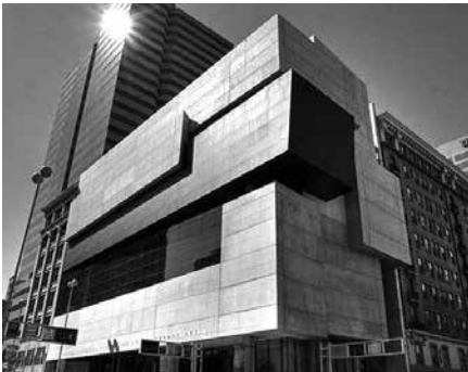
Заха Хадід. Центр сучасного мистецтва Розенталь. Цинциннаті, США. 2003 р