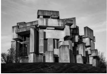
Фріц Вотруба. Костел св. Трійці. Відень. 1976 р