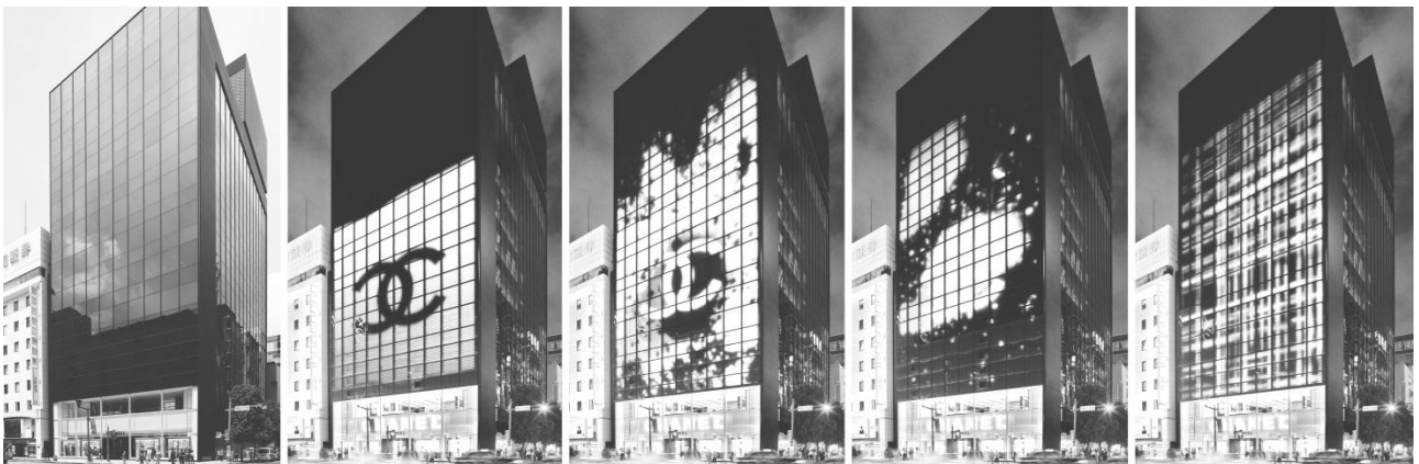
Рис. 4. Магазин Шанель в кварталі Гінза, Токіо, Японія

Якості синтезу в естетиці об'єктів медіа-архітектури визначаються гармонійністю поєднання матеріальної архітектури, засобів передачі інформації та безпосередньо інформаційного повідомлення. Оцінку якості даної естетичної складової можна дати, визначивши загальну змістовність та доцільність конкретного композиційного рішення. Досконале поєднання архітектурної та медійної складової дозволяє створювати об'єкти соціального впливу високої естетичної виразності. Серед прикладів узгодженої взаємодії архітектурної та медійної складової можна навести проект американського архітектора Пітера Маріно – магазин Шанель в кварталі Гінза, Токіо. Аскетична коробка об'єму вкрита медіафасадом, що є засобом самовираження бренду та доповненням функціональної структури будівлі (рис. 4).