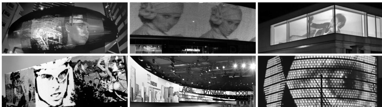
Рис. 1. Приклади медіа-текстури архітектурних об'єктів

(рис. 2). Складові медіа фактури, такі як різноманітні світлові елементи, пристрої відбиття та розсіювання світла мають самостійну естетичну цінність, а утворені з них поверхні часто надають об'єктам виразність та неповторність.