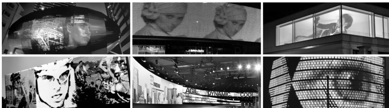
Рис. 1. Приклади медіа-текстури архітектурних об'єктів

(рис. 2). Складові медіа фактури, такі як різноманітні світлові елементи, пристрої відбиття та розсіювання світла мають самостійну естетичну цінність, а утворені з них поверхні часто надають об'єктам виразність та неповторність.