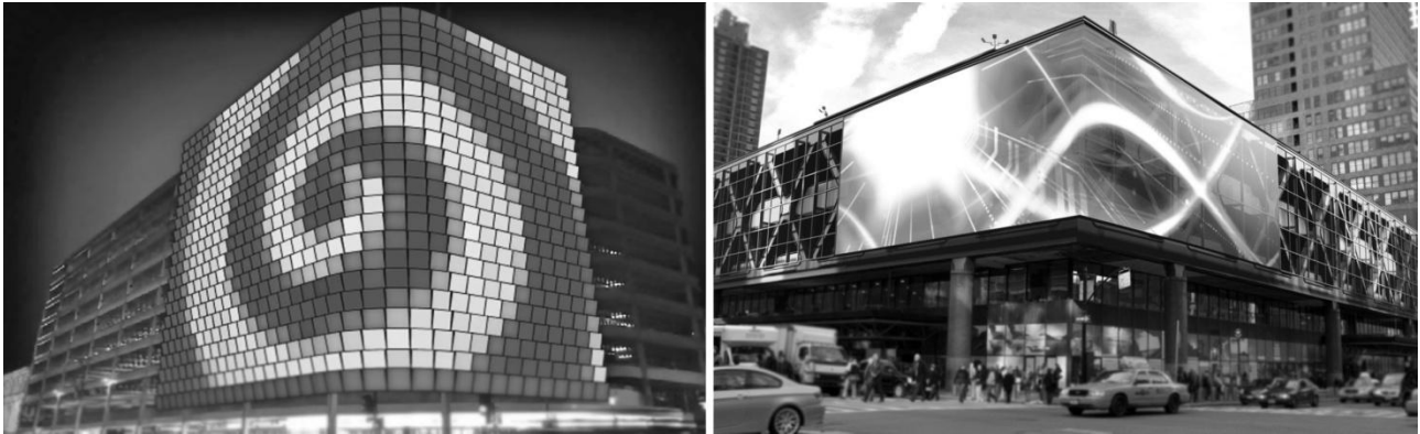
Рис.3. Закономірності виявлення медіа-текстури та медіа-фактури. Зліва направо: паркінг, Аделаїда, Австралія та автовокзал РАВТ, Нью-Йорк, США

або медіа-фактури можливий перерозподіл акцентів між предметною архітектурою та інформаційним потоком, що розширює спектр засобів досягнення доцільності та архітектурної виразності.