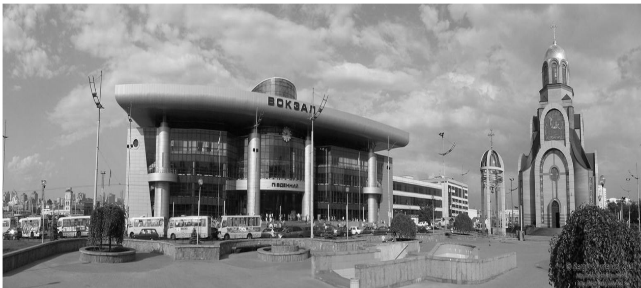
Рис. 3 панорама комплексу Київ-Пасажирський.

вночі. Проектувальники працювали без вихідних днів по 12 годин на добу. На будівельних майданчиках налічувалось до 5000 робітників. Авторський нагляд здійснювався два рази на добу: вранці і ввечері. Особисто Г.М. Кірта кожен день о 12 годині вночі проводив обхід будівництва в супроводі керуючого будівництвом Даниленка І.Е. і іншими керівниками субпідрядних організацій. За-