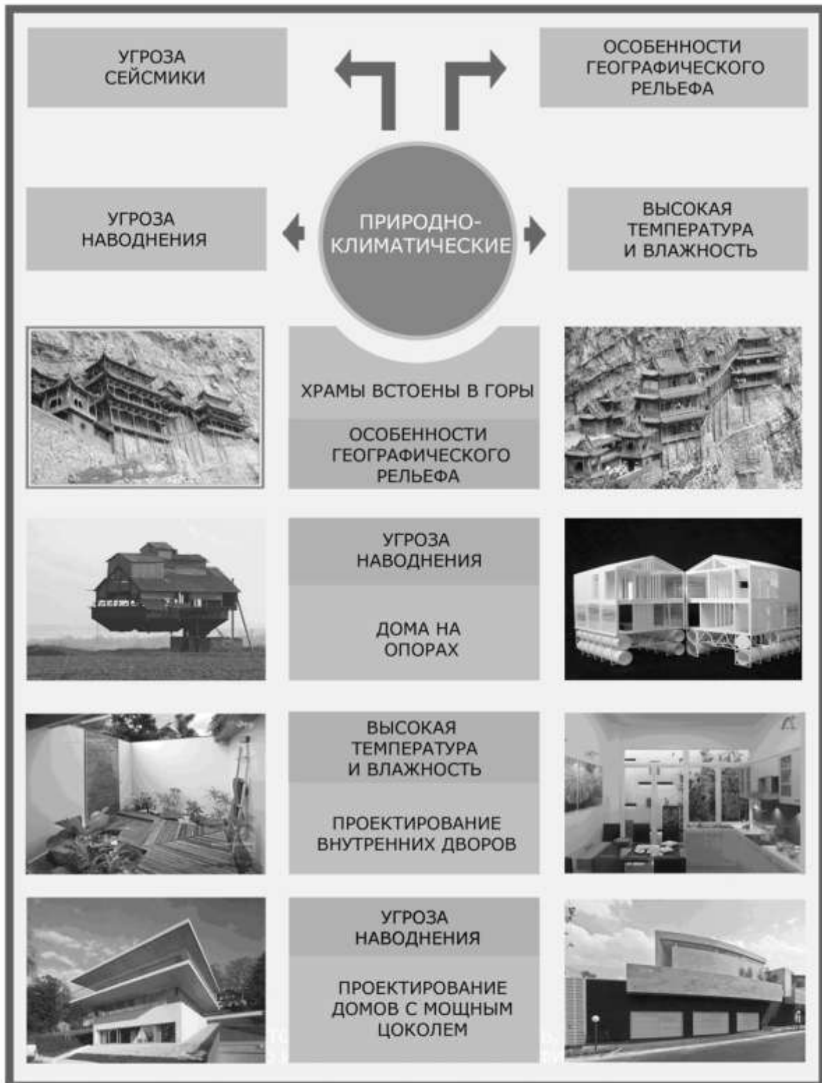
Рис. 2. Природно-климатические факторы и их влияние на формирование архитектуры экомuzeя