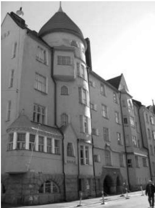
Рис. 1 Хельсинки (Гельсингфорс). Кауппиаанкату 7. Доходный дом Олофсборг

Общие для региона природно-климатические особенности, общая история, неоднократно переходящие из рук в руки земли создали базу для возникновения сходных процессов в культурной жизни. В конце XIX – начале XX века регион в целом переживал сложный период развития промышленного производства, возникновения национальной буржуазии – того среднего класса, выразителем вкусов которого и стал нарождающийся модерн. Необходимость интеграции в общеевропейские процессы, с одной стороны, подталкивали государства региона к принятию общеевропейских стремительно менявшихся эстетических норм, а с другой стороны – международный интерес к самобытному народному скандинавскому, финскому, русскому искусству, заставлял страны региона внимательно отнестись к своему национальному культурному своеобразию. Обращение к древнему искусству, к народным корням, проявившееся в архитектуре, живописи, прикладном искусстве стран региона – заставляло увидеть новое в старом, показать современность через архаику.