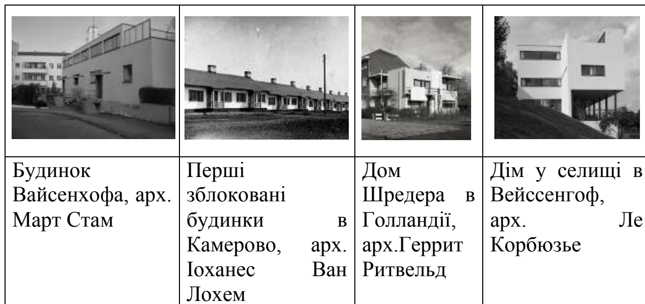
Рис 1. Приклади проектів житлових будинків.

будівель Марта Стама, Іоханес Ван Лохем, Рітвельд Г., Ле Корбюзьє та ін. (Див. Рис.1).