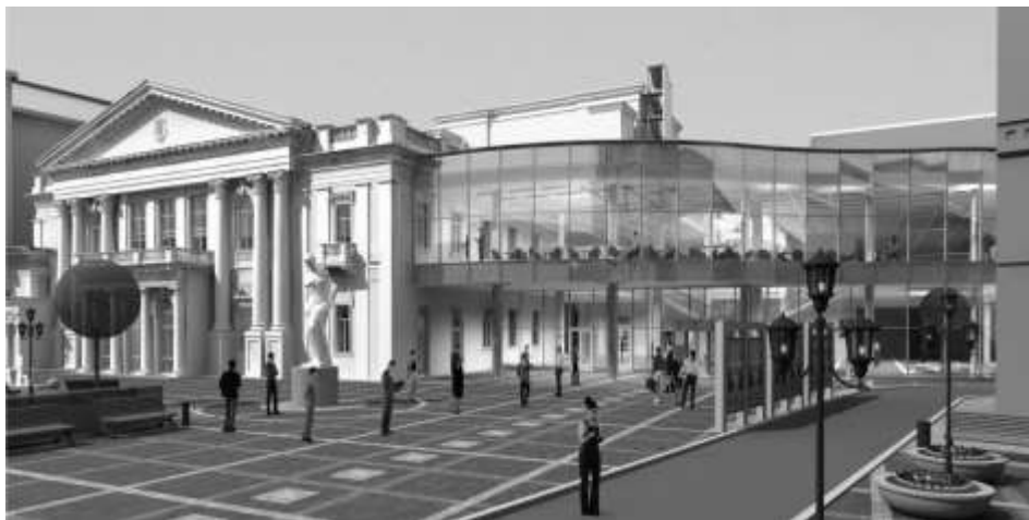
Рис. 4 Проект реконструкції харківської філармонії (КТМ «Мир»)

Це і просторі гардероби та санвузли для глядачів, зручні артистичні, реабілітаційний центр і кафе для музикантів, три репетиційних зали, комплекс столярних, художніх, бутафорських майстерень і багато іншого. Комплекс буде оснащений усіма видами сучасного технологічного і звуко-технічного обладнання. Архітектурний вигляд будівлі так само отримає нове трактування на основі включення в автентичний об'єм будівлі сучасних архітектурних форм нової вестибюльної групи (Рис. 4).