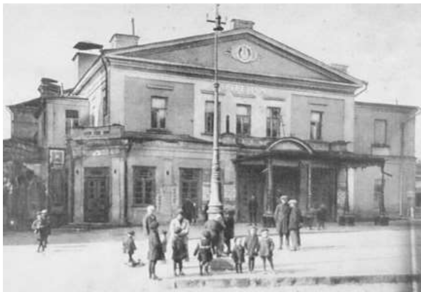
Рис.2. Новий фасад Харківської філармонії (поч. ХХ ст.)

У 1891 році відбулась чергова реконструкція – зводиться сценічна коробка з підсобними приміщеннями. У 1896 році за проектом архітектора М. І. Дашкевіча прибудовано велике парадне фойє з колонами, а в 1914 році змінили зовнішній вигляд фасадів за проектом А. І. Горохова (Рис.2), та для збільшення кількості глядацьких місць були добудовані другий ярус лож і амфітеатр бельєтажу [4].