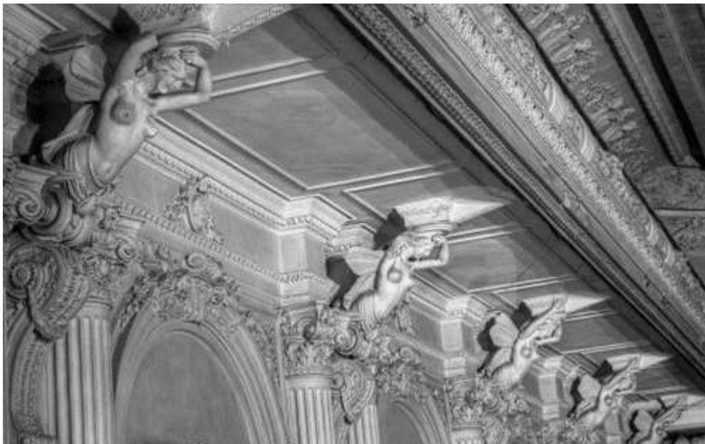
Рис.1. Інтер'єр великого залу Харківської філармонії