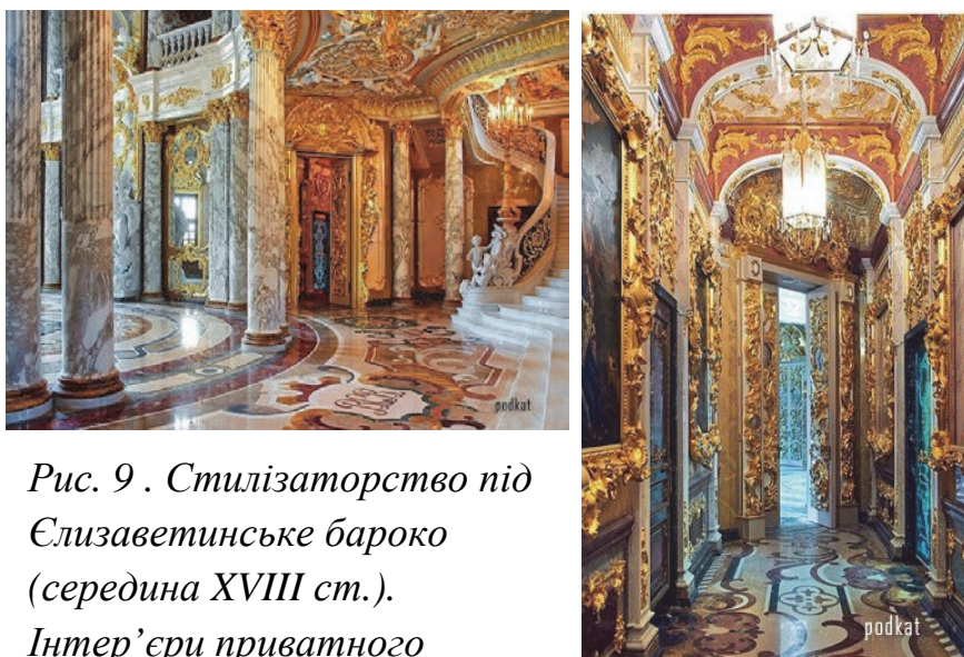
Рис. 9 . Стилізаторство під Єлизаветинське бароко (середина XVIII ст.). Інтер'єри приватного будинку під Петербургом XXI ст.