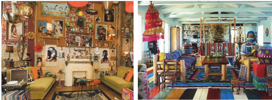
Рис. 4 . Приклад інтер'єру в напрямку сентиментального Кітчу.