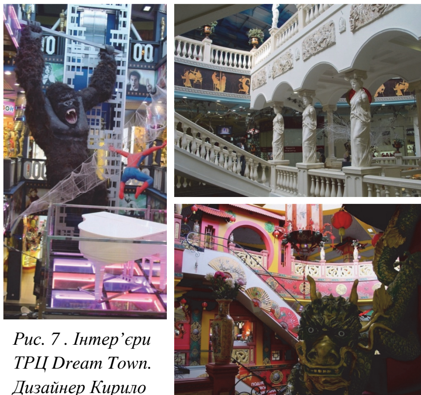
Рис. 7 . Інтер'єри ТРЦ Dream Town. Дизайнер Кирило Фадєєв. Свідомий кітч