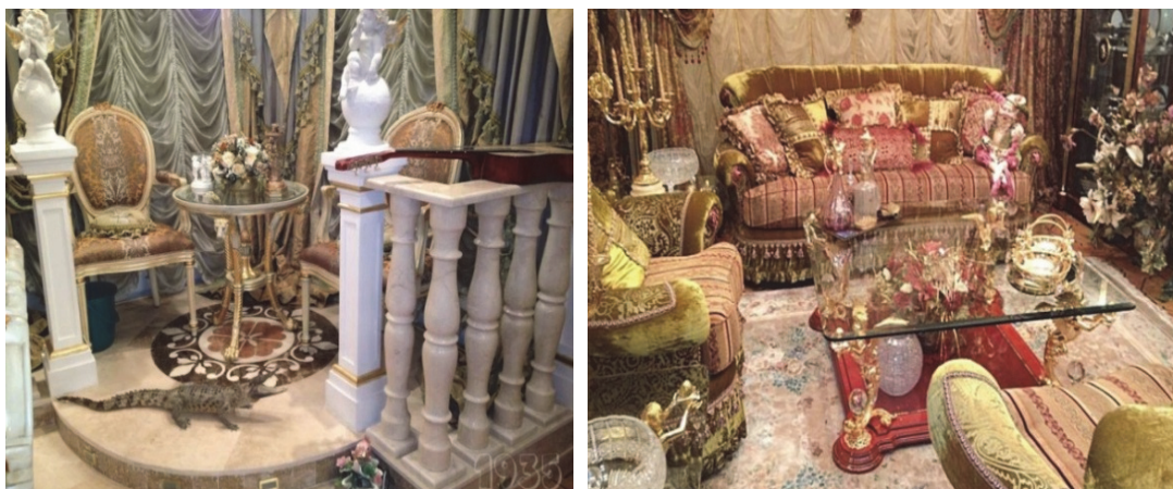
Рис. 11 . Приклад Кічу різновиду «дорогий несмак» з великою кількістю коштовних речей