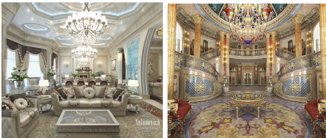
Рис. 8 . Приклади інтер'єрів в стилі Кімч. Різновид «несвідомий професійний»