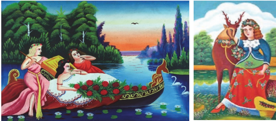
Рис. 2 . Приклади народного кітчу в творах художників примітивістів.