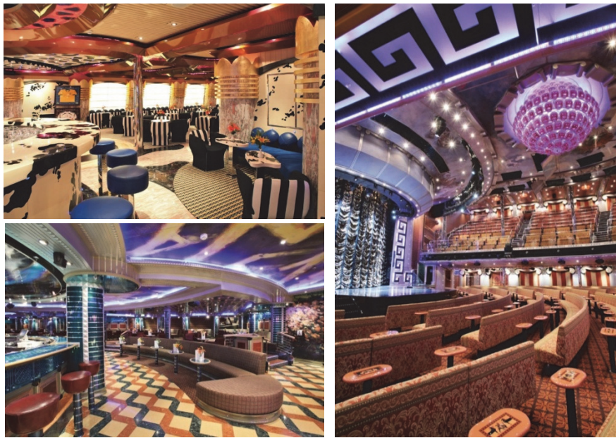
Рис. 6 . Інтер'єри круїзного судна «Коста Конкордія» Приклад свідомого професійного Кітчю.