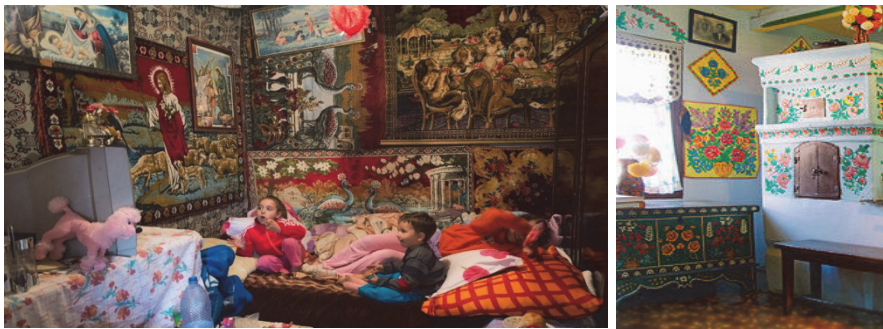
Рис. 3. Інтер'єри в стилі народного, не професійного Кітчу.