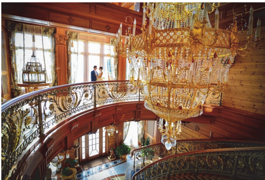
Рис.12 . Приклад рішення інтер'єру в категорії «дорогий несмак». При поєднанні в одному інтер'єрі непеєднваних стилів і матеріалів

Або поєднання в одному інтер'єрі непеєднваних стилів і матеріалів, що кричать про свою високу вартість. (Рис. 12). Кришталева люстра, позолочена ковка в перилах, пілястри (мабуть дерев'яні, але лаковані) і зруб з сучками – це вже перебір матеріалів, який неможливо списати на «дизайнерську