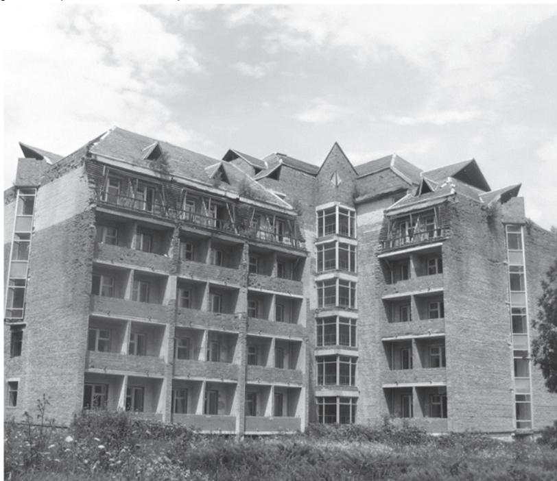
Фото. 1. Руїни недобудованого корпусу санаторію «Збруч»

року) є те, що призвело до припинення практичної діяльності санаторіїв “Медобори” у 1998 році та “Збруч” у 2010 році. На сьогодні вони перетворилися на руїни (Фото.1,2,3).