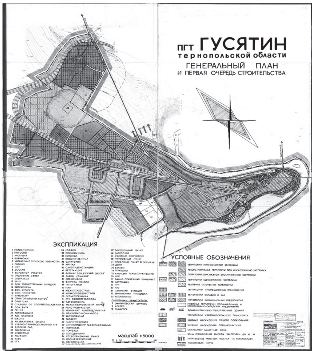
Рис. 2. Генеральный план смт Гусятин 1981 року

пов'язаних з використанням рекреаційного потенціалу та розвитку селища як регіонального курорту.