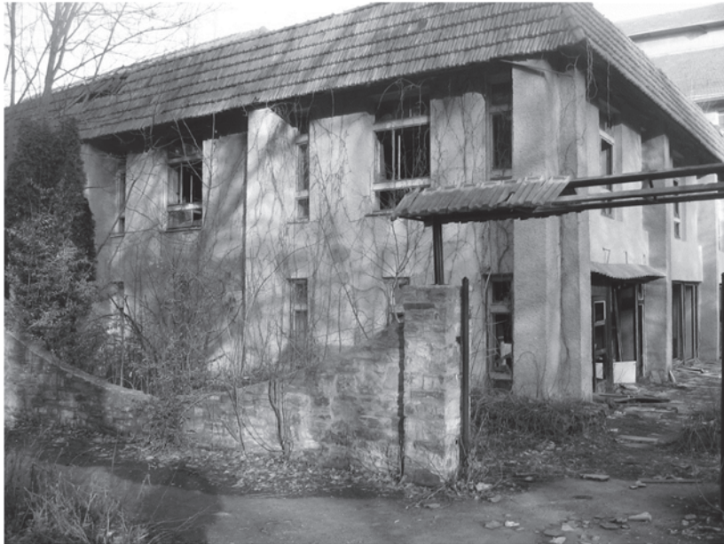
Фото. 2. Руїни санаторію «Медобори»

влади та місцевого самоврядування бережно ставитися та дотримуватися чинників просторового розвитку, містобудівної документації, а також прийнятих планувальних рішень.