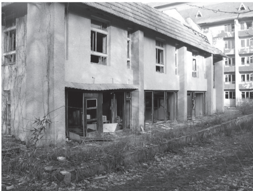
Фото. 3. Руїни санаторію «Медобори»

Так, правила функціонального використання територій, які були встановлені у генеральних планах селища, керівництвом місцевого самоврядування та районної державної виконавчої влади, принципово порушені. В наслідок чого набула широкого розповсюдження ситуація безконтрольного розкрадання територіальних ресурсів. Це призвело і продовжує призводити до руйнування передбаченої генпланом функціонально – територіальної структури населеного пункту. Процес розроблення та реалізації генплану кожного