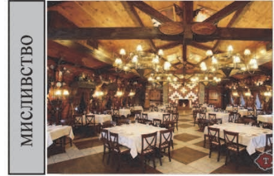
Ресторан "Тандир", пгт Козин, Конча Заспа, Україна