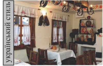
Шноок "Козачок", с.Щасливе, Київська обл., Україна