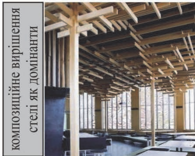
"Sakenohana", Лондон, Великобританія 2007

натуральні оздоблювальні матеріали, різні види озеленення і водних елементів, природне каміння та ін.