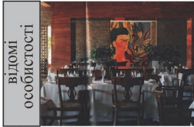
Ресторан "Frida", Рів'єра-Мая, Мексика

визначена тематична складова знаходить художньо-композиційне відображення у вирішенні образу інтер'єру