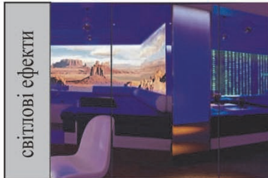
Бар "24", Лондон, Великобританія, інтерактивні стіни з сотнею світлодіодів

використання сучасних технологій - світлові ефекти, режисура світла, інтерактивні технології