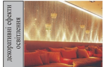
"Red Room" in "The Shore Club", Майами-біч, Флорида, США, Anda Andrei