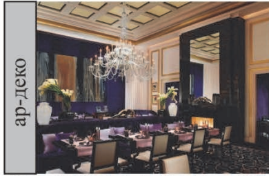
Ресторн "Joel Robuchon", Лас-Вегас, Невада, США

використання в інтер'єрі історико усталених стилів і стилізації; етнічних стилів; сучасних стилістичних напрямів та стилізації