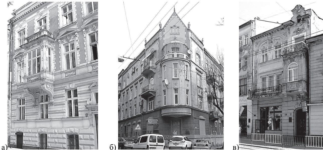
Рис. 1. Балкони, які розташовані над еркерами: а) вул. Рилєєва, 9; б) вул. Японська, 18; в) вул. Дорошенка, 11.

У Львові часто у вирішенні фасадів використовували лише один балкон, розміщений на рівні другого або третього поверхів переважно на центральній осі фасаду. Архітектори часто розташовували балкони на фасаді групами, щоб виділити певну частину композиції. За допомогою балконів також створювали горизонтальне членування фасаду. Нерідко балкон використовували як завершальний елемент еркера (рис. 1). Це характерне для випадків, коли еркер проходив не через усі поверхи будівлі, а також для «маленького» еркера, який влаштовували лише на одному з поверхів (рис. 1а, в). У Львові можна часто побачити поєднання еркеру з балконом над ним із бічними балконами в один архітектурний елемент. За допомогою цього способу архітектори збільшували виразність еркера (рис. 1в).