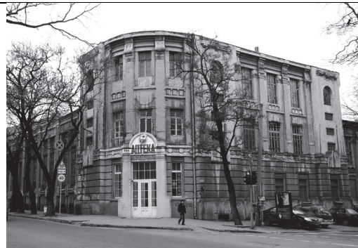
Рис.2. Часофасовна фабрика на розі Троїцької і Канатної