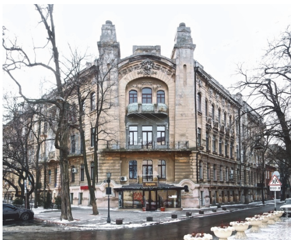
Рис.5. Прибутковий дім Луцького