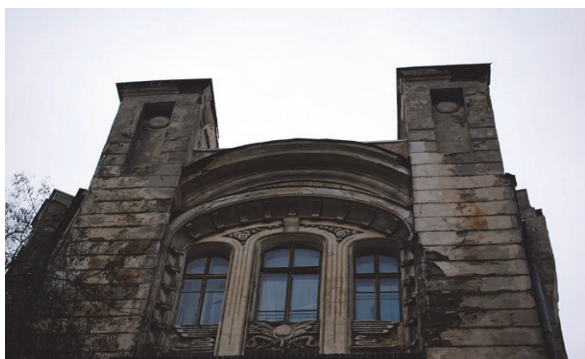
Рис.7. Барельєф дому Вуфгарт