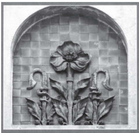
Рис.3. Елемент рослинного орнаменту