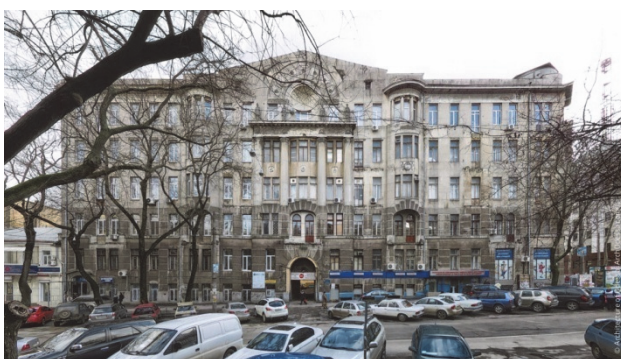
Рис.8. Будинок Асвадунова