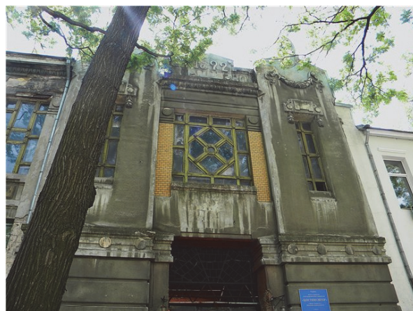
Рис.4. Елемент мозаїчного панно