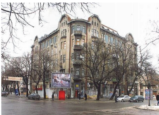
Рис.9.Будинок на вулиці Єкатерининська, 35