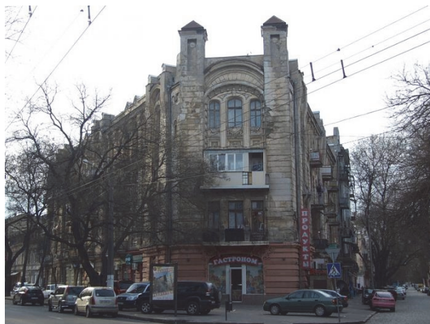
Рис.6. Прибутковий дім Вуфгардт