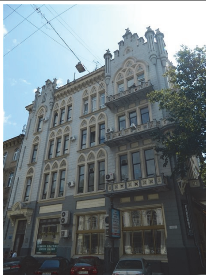
Рис.11. Будинок Григор'євої на Ланжеронівській,15