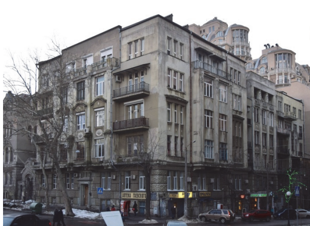
Рис.10. Будинок Маргуліс