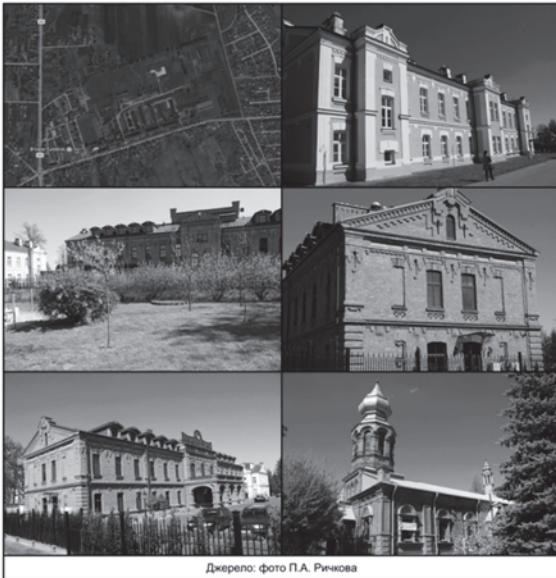
Рис. 1. Гарнізонний комплекс у м. Грубешів, Польща