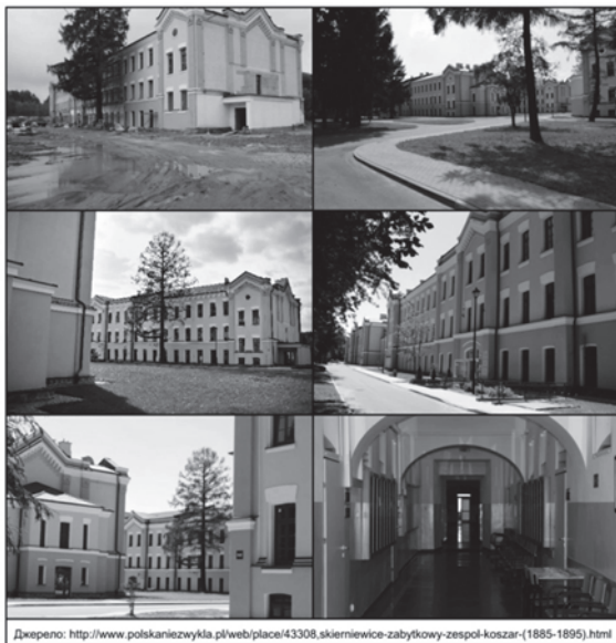
Рис. 3. Гарнізонний комплекс у м. Скерневіце, Польща

Внутрішній простір військових казарм перетворено на простір для творчості, презентацій та просування сучасного мистецтва, експериментальної культури. У комплексі є павільйон для проживання митців. Зовнішній вигляд будівель було змінено та підпорядковано загальній концепції центру: стіни збережених казарм поштукатурено та пофарбовано у світлі кольори, закриті декоративне оздоблення фасадів (рис. 4).