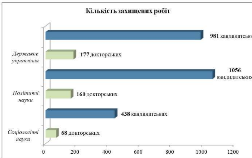
Рис. 1. Розподіл захищених робіт у спеціалізованих учених радах України з державного управління впродовж 1997-2011 рр.

2) у галузі соціологічних наук - за сімома: 22.00.01 - теорія та історія соціології; 22.00.02 - методологія та методи соціологічних досліджень; 22.00.03 - соціальна структура, соціальні інститути та соціальні відносини; 22.00.04 - економічна соціологія; 22.00.05 - соціологія політики; 22.00.06 - соціологія культури, науки та освіти; 22.00.07 - соціологія управління;