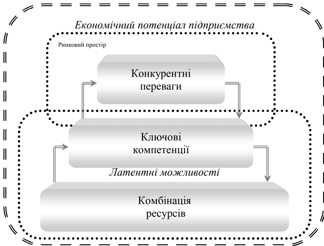
Рис. 2 Модель економічного потенціалу підприємства*

сутність якого окреслюється комплексністю його виразів.